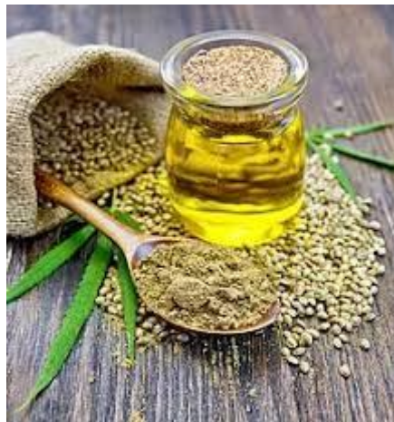
Slika 2. Ulje iz sjemenki konoplje (Anonymous, 2013)

Proizvodnja ulja iz sjemenki konoplje započela je prije 3 tisućljeća. Ulje sjemenki industrijske konoplje ubraja se u sušiva ulja, a nekada se upotrebljavalo u proizvodnji boja, lakova te sapuna. Koristi se i u ljudskoj prehrani, a pojedine komponente ulja imaju povoljan utjecaj na ljudsko zdravlje (Kriese i sur., 2004). Ulje odlikuje specifičan sastav masnih kiselina od kojih su najznačajnije esencijalne masne kiseline ( \alpha -linolenska i linolna). Brojne kliničke studije pokazale su da ima pozitivno djelovanje na imunološki sustav i opće zdravstveno stanje organizma, da je učinkovito u zacjeljivanju rana te da povoljno djeluje na dermatitis (Škevin i sur., 2011). Osim u prehrani, koristi se i u kozmetici jer djeluje antimikrobno, antiupalno, antioksidacijski, sprječava starenje kože, te uravnotežuje pH i vlažnost kože (Anwar i sur., 2006).