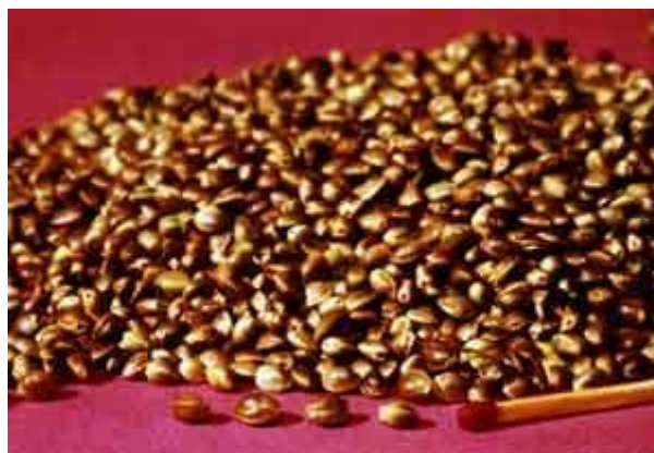
Slika 1. Usporedba sjemenke konoplje s glavom šibice (Small i Marcus, 2002)

Sjemenka industrijske konoplje nutritivno je izuzetno vrijedna sirovina (Kiralan i sur., 2010), a osim toga pokazuje pozitivan zdravstveni učinak u snižavanju razine kolesterola i visokog krvnog tlaka (Oomah i sur., 2002). U punoj zrelosti sjemenka posjeduje relativno tvrdu ovojnicu, a oblikom varira od kuglastog prema izduženom. Osim toga, varira i veličinom, a najčešće je veličine glave šibice (Small i Marcus, 2002). Sadržaj ulja u sjemenkama konoplje varira od 28 do 35 % ovisno o sorti, klimatskim uvjetima, geografskom području te godini uzgoja (Matthäus i Brühl, 2008). Osim ulja, sjemenke konoplje sadrže 20 – 25 % proteina, 20 – 30 % ugljikohidrata te 10 – 15 % netopljivih vlakana što ih čini izrazito nutritivno vrijednom hranom. Također sadrže vitamine A ( \beta -karoten), fitosterole, fosfolipide, vitamine B skupine (B1, B2, B3, B6), vitamine D i E (prirodni antioksidansi) u probavljivom obliku te bogati udio minerala uključujući fosfor, kalij, magnezij, sumpor, kalcij, željezo i cink (Anwar i sur., 2006; Kiralan i sur., 2010).