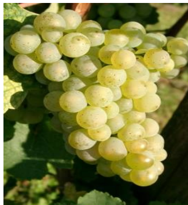
Slika 1. Grozd sorte Rajnski rizling (Anonymous 2, 2009)

Ova sorta je jedan od najstarijih kultivara vinove loze u svijetu i smatra se najplemenitijom bijelom sortom, a potječe iz doline rijeke Rajne u Njemačkoj. Karakteristike su naglašena kiselost, punoća i elegantna aroma te plemeniti, diskretni miris. Vino proizvedeno od Rajnskog rizlinga je puno, zaokruženo, sa značajnim mirisom i aromom, ima dug životni vijek te je žuto zelenkaste boje. Starenjem njegova vrijednost u pravilu raste. Rajnski rizling (Slika 1) je i dobra podloga plemenitoj plijesni, koja se razvija na već zrelim bobicama što daje osnovu za odlična suha, ali i slatka vina s prirodnim neprevrelim šećerom. Mlado vino ima svježju voćnu aromu koja podsjeća na cvijet akacije, breskve, trešnje, a kod viših stupnjeva kvalitete i na cimet, med ili marelicu (Fazinić i Milat, 1994; Mirošević, 1996; Maletić i sur., 2015).