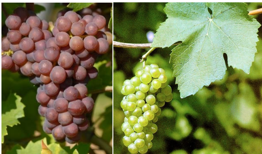
Slika 2. Sivi pinot (lijevo) (Anonymous 3, 2013) i Bijeli pinot (desno) (Anonymous 4, 2013)

Pinot Bijeli (Slika 2, desno) je stara sorta grožđa, rasprostranjen je uglavnom u Njemačkoj i Italiji, a u Hrvatskoj ga najviše ima u Slavoniji. Nastao je spontanim križanjem Pinota sivog i Pinota crnog. Daje vino slamnato žute boje sa zelenkastim odsajem, a starenjem daje zlatnu boju. Laganog je okusa koji aromom podsjeća na jabuku i breskvu. Ova sorta nije prilagođena jako vlažnim i vapnenastim tlima, stoga najbolje uspijeva u suhoj klimi (Anonymous 4, 2013).