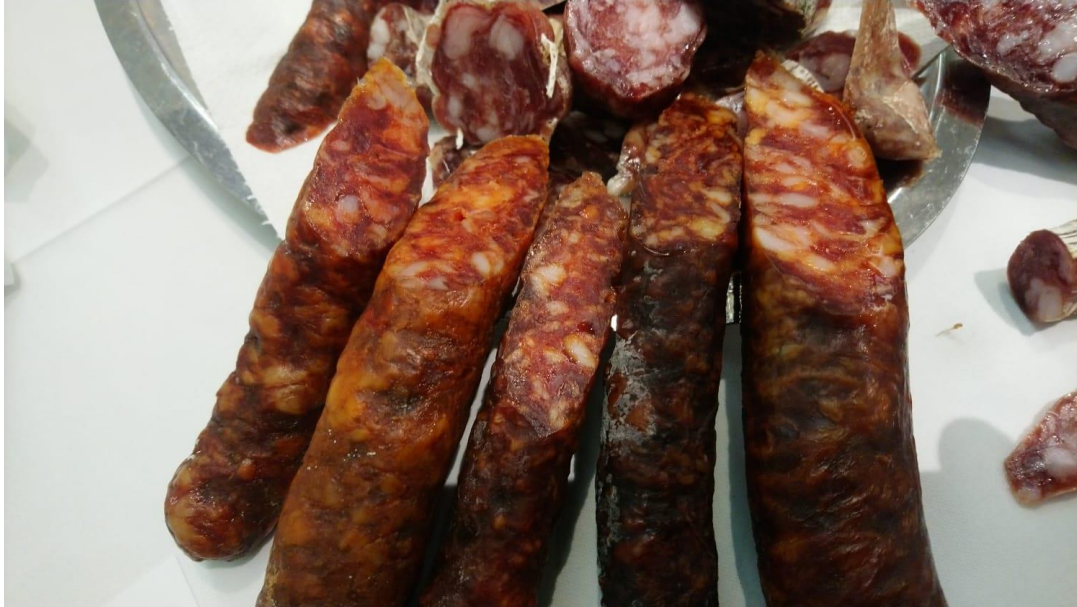
Slika 2. Slavonska kobasica

plantarum ). Ovi mikroorganizmi, zajedno s lipolitičkim i proteolitičkim enzimima određuju karakteristike konačnog proizvoda (Kovačević i sur., 2009).