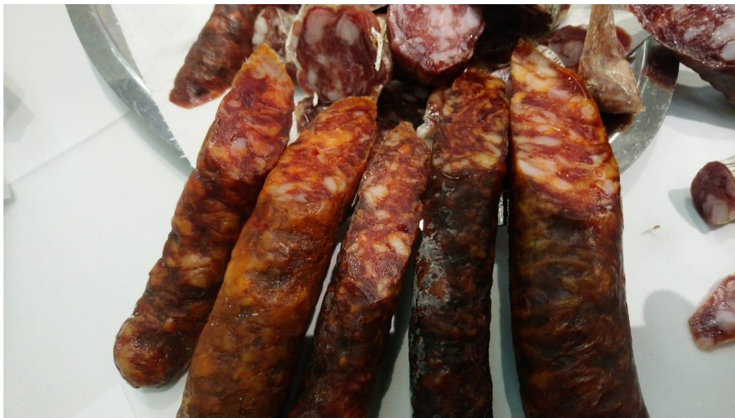
Slika 2. Slavonska kobasica

plantarum ). Ovi mikroorganizmi, zajedno s lipolitičkim i proteolitičkim enzimima određuju karakteristike konačnog proizvoda (Kovačević i sur., 2009).