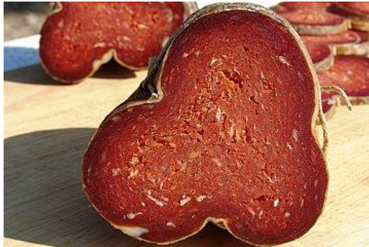
Slika 3. Slavonski kulen (Anonimus 1)

prehrambenih proizvoda (NN 86/2013), Slavonski kulen je zaštićen oznakom zemljopisnog podrijetla.