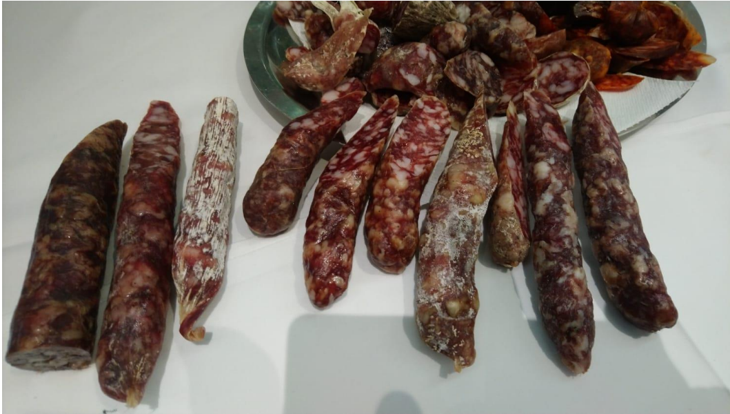
Slika 1. Domaća istarska kobasica

pohraniti u masti ili ostaviti na zrenju (fermentaciji) te od njih proizvesti trajnu istarsku kobasicu. Sazrijevanje kobasica traje nakon sušenja do 40 dana pri kontroliranim uvjetima ( t \leq 16 \text{ }^\circ\text{C} ; r.v. 60 – 65 %). Istarske kobasice u starosti od 40 dana stavljaju se na tržište kao trajne kobasice (Bratulić i sur., 2015).