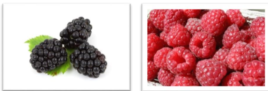
Slika 2. Plodovi kupine i crvene maline [45, 46].

antioksidacijska svojstva koja su odgovorna za poboljšanje zdravlja [32]. Plodovi ovog voća pokazuju kemoprevencijski i terapijski učinak na nekoliko vrsta raka, uključujući i rak dojke. Najveću inhibiciju lipidne peroksidacije pokazale su kupine ( Rubus jamaicensis , 74 %) i crne maline ( Rubus acuminatus , 71 %), dok su nešto manju aktivnost pokazale crvene maline ( Rubus rosifolius , 47 %) (Slika 2.) i crne maline ( Rubus racemosus , 64 %). Inhibicijom ciklooksigenaze 2 (COX-2) postižu se antikancerogena svojstva, tj. njegovim reguliranjem u upalnim stanicama uz posredovanje citokinima i faktora rasta. R. acuminatus sa 71 % inhibicijom COX-2 enzima ciklooksigenaze se pokazala kao plod najveće učinkovitosti, dok je R. jamaicensis imala najveći utjecaj na inhibiciju rasta tumorskih stanica od 50 % kod stanica tankog crijeva, dok je kod dojke imala 24 %, pluća 54 % i želuca 37 % [44].