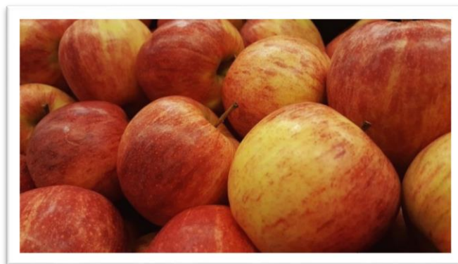
Slika 1. Plodovi jabuke sorte Gala [42]