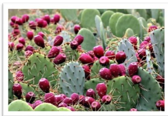
Slika 5. Plodovi indijske smokve [63]

Chandoura i sur. su usporedili kemijske sastave dvaju sorata Opuntie ( Opuntia microdasys (Lehm.) Pfeiff i Opuntia macrorhiza (Engelm.), obzirom na pulpu, sjemenke i kladodij, gdje je nađen znatan udio prehrambenih vlakana u sjemenkama obaju sorata (40 g/100 g SM). Detektirana količina bila je veća od one određene u sjemenkama sorti Opuntia joconostle i Opuntia matudae , a udio netopljivih prehrambenih vlakana u svim uzorcima je bio veći od topljivih. Također, sjemenke su se pokazale kao najprikladniji izvor mikroelemenata, osobito bakra (392 µg/100 g SM za O. mycrodasys i 992 µg/100 g SM za O. macrorhiza ) i cinka (143 µg/100 g SM za O. mycrodasys i 237 µg/100 g SM za O. macrorhiza ). Od makroelemenata identificirani su kalcij, magnezij, kalij i natrij. U svim je uzorcima u najvećem udjelu određen kalij, osim u sjemenkama O. mycrodasys , gdje je u najvećem udjelu određen kalcij. Natrij je određen u vrlo malim količinama, dok su velike količine magnezija pronađene u sjemenkama (7,3 mg/100 g SM) i kladodiju (5,8 mg/100 g SM) O. mycrodasys [66].