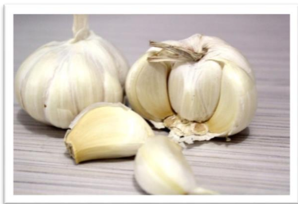
Slika 6. Plod češnjaka [2]

tiosulfinate kao što je alicin [94]. Svi ovi navedeni procesi degradiraju i mijenjaju efektivnost, strukturu i sadržaj OSS-a. Istodobno, prema nekim podacima kuhanje i prženje smanjuje sadržaj fenolnih i OSS-a, te antioksidacijsku aktivnost, dok prema drugim studijama ovaj tip obrade nema utjecaja. Najpoželjnije je kuhati zdrobljeni češnjak zbog formiranja OSS-a i ublaženog smanjenja sadržaja tiosulfinata. Kod termičke obrade, najveći gubitak ukupnih fenola zapažen je pri blanširanju naspram drobljenju i prženju češnjaka. Nasuprot tome, prženje je uzrokovalo najveći gubitak ukupnih fenolnih kiselina, dok je značajno smanjenje OSS-a (pretežito alicina), nastalo u uvjetima