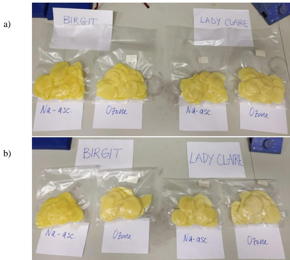
Slika 4. Pakovine minimalno procesiranog krumpira 1. dan skladištenja (a) i 8. dan skladištenja (b) (Na-asc. = natrijev askorbat; Ozone = ozonirana voda) ) (vlastita fotografija)

Toplinski tretman uzoraka sastojao se od kuhanja i prženja. Kuhanje je provedeno na način da je 150 g uzorka stavljeno u destiliranu vodu zagrijanu na temperaturu vrelišta (omjer mase uzorka i vode iznosio je 1:5) te kuhano 15 minuta. Kuhani uzorci su ocijeđeni i ostavljeni da se ohlade. Prženje je provedeno u fritezi pri čemu je 150 g uzorka prženo u 1,5 L suncokretovog ulja na temperaturi od 180 °C kroz 5 minuta. Prženi uzorci su ocijeđeni od ostatka ulja pomoću papirnatih ubrusa te ostavljeni da se ohlade.