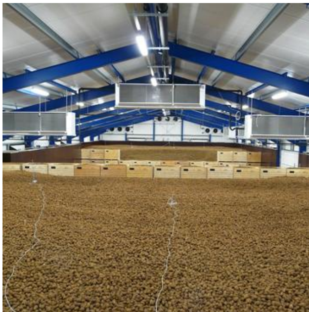
Slika 1. Moderno skladište krumpira (Anonymous 1, 2019)

Tijekom skladištenja krumpira dolazi do promjena u njegovom kemijskom sastavu. Pri niskim temperaturama skladištenja, a posebice ako je temperatura niža od 4 °C dolazi do promjene u omjeru škroba i jednostavnih šećera u krumpiru, odnosno do zaslađivanja (Watada i Kunkel, 1955). Pri tom procesu škrob se djelomično razgrađuje do glukoze što dovodi do slatkastog okusa krumpira, ali i do ubranog posmeđivanja te promoviranja nastanka akrilamida zbog reakcije nastale glukoze i slobodnog asparagina u krumpiru prilikom procesiranja na visokim temperaturama (Amrein i sur., 2003). Otpornost na zaslađivanje, temperature pri kojima se najintenzivnije događa i količina glukoze koja nastaje prilikom zaslađivanja kod skladištenja gomolja krumpira na niskim temperaturama specifične su karakteristike pojedinih sorti te kao takve predstavljaju bitan čimbenik pri odabiru odgovarajuće sorte namijenjene pojedinim metodama procesiranja (Watada i Kunkel, 1955; Amrein i sur., 2003).