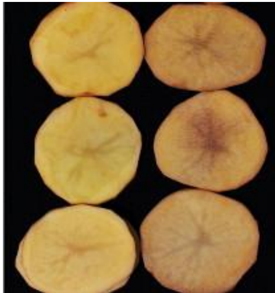
Slika 2. Posmeđivanje minimalno procesiranog krumpira (Wang i sur., 2015)

Diskoloracija tkiva uslijed enzimskog posmeđivanja glavni je faktor koji dovodi do smanjenja kvalitete minimalno procesiranog voća i povrća, pri čemu dolazi do promjene u senzorskim svojstvima proizvoda, ali i do narušavanja njegovog izgleda što potrošači navode kao glavni razlog zbog kojeg ne bi izabrali takav proizvod. Pored toga, degradacija uzrokovana enzimskim posmeđivanjem dodatno skraćuje rok trajanja proizvoda. Upravo iz tih razloga prevencija enzimskog posmeđivanja neophodan je korak pri proizvodnji minimalno procesiranog voća i povrća (Tomas-Barberan i Espin, 2001). Na slici 2 prikazan je primjer posmeđivanja kod minimalno procesiranog krumpira.