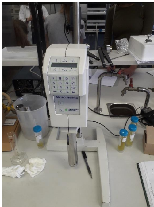
Slika 4. Reometar (RM 180, Rheometric Scientific, Inc., Piscataway, USA)

Reološka svojstva otapala određivana su na rotacijskom reometru Rheometric Viscometer (Model RM 180, Rheometric Scientific, Inc. Piscataway, USA), gdje su primijenjenom smičnom brzinom ( D ), smičnim naprezanjem ( \tau ) i prividnom viskoznošću ( \eta ), određivani reološki parametri koeficijent konzistencije ( k ) i indeks tečenja ( n ).