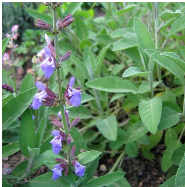
Slika 1. Kadulja (Anonymus 2, 2019)

Kadulja ( Salvia officinalis L.) pripada obitelji Lamiaceae, aromatična je biljka poznata po sadržaju eteričnog ulja (Antolić i sur., 2018). Rod Salvia je najveći rod porodice Lamiaceae koji obuhvaća oko 1000 vrsta. Raste širom svijeta, obilno je rasprostranjena u Europi oko Sredozemlja, u Jugoistočnoj Aziji te Srednjoj i Južnoj Americi. Kadulja je višegodišnja zimzelena biljka s kratkim drvenastim stabljikama koje narastu do 60 cm. Prekrivena je dlakama i sivozelene je boje. Na vrhu stapke nalaze se ljubičasti cvjetovi S. officinalis L. jedna je od najcjenjenijih biljaka zbog bogatstva sadržaja esencijalnog ulja i njegovih brojnih biološki aktivnih spojeva. Smatra se da ima najveći prinos esencijalnog ulja među vrstama Salvia . Eterično ulje je izuzetno složena mješavina različitih aktivnih spojeva. Dvije glavne kemijske klase sekundarnih metabolita identificirane su kao tipični proizvodi biljke: terpenoidi i fenoli (Grdiša i sur., 2015). Eterično ulje kadulje sadrži monoterpene \alpha - i \beta -tujon, kamfor, 1,8-cineole i borneol, a ponekad i u većim količinama seskviterpene \alpha -humulen i \beta -kariofilen.