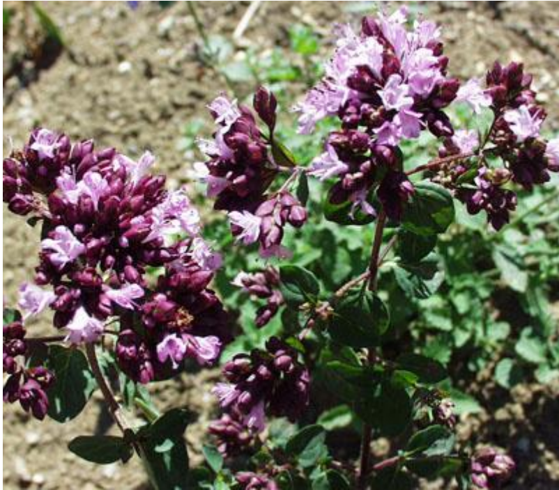
Slika 2. Origano (Anonymus 3, 2019)

Kao aromatična i ljekovita biljka vrlo je bogata eteričnim uljima koja cijeloj biljci daju ugodan miris. Glavne sastavnice eteričnog ulja su: karvakrol, timol, p -cimen, cis -ocimen, \gamma -kardinen. Osim eteričnih ulja sadrži i gorke tvari, tanin i dr. Na sadržaj eteričnih ulja značajan utjecaj imaju ekološki čimbenici i klimatske prilike u kojima biljka raste. Broj i veličina žlijezda na listovima kao i pricvjetnih listova i cvjetova znatno se razlikuju u uzorcima bilja ovisno o području prikupljanja. U našoj se zemlji idući od juga prema sjeveru oni znatno smanjuju, a time i sadržaj eteričnog ulja u pojedinoj biljci. Vrijeme prikupljanja također može znatno utjecati na količinu eteričnog ulja i na količinu njegovih glavnih sastavnica. Količina eteričnog ulja kod biljaka prikupljenih u ljetnom periodu značajno je viša od one kod biljaka prikupljenih u jesenskom periodu (Carović i sur., 2004). Djelovanje i uporaba origana: potiče probavu, poboljšava rad jetre i žučnog mjehura (Toplak-Galle, 2001). Ulje origana se koristi za proizvodnju sapuna, deterdženata i parfema (Carović i sur., 2004).