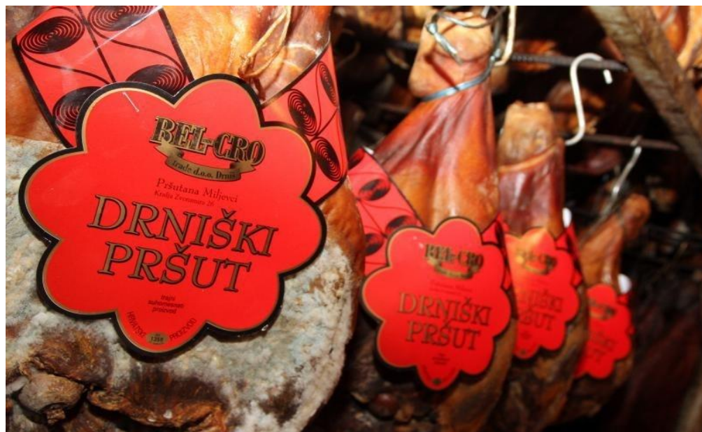
Slika 3. Drniški pršut (Anonymous 2, 2015)