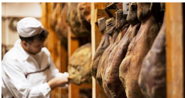
Slika 2. Istarski pršut (Anonymous 1, 2015)