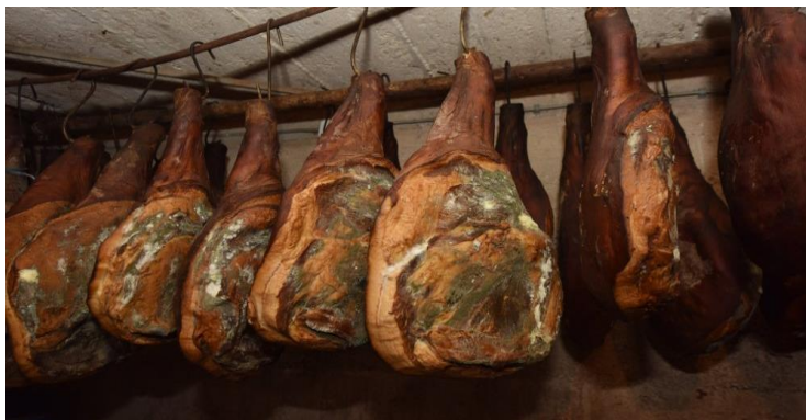
Slika 4. Krčki pršut (Jelavić, 2019)