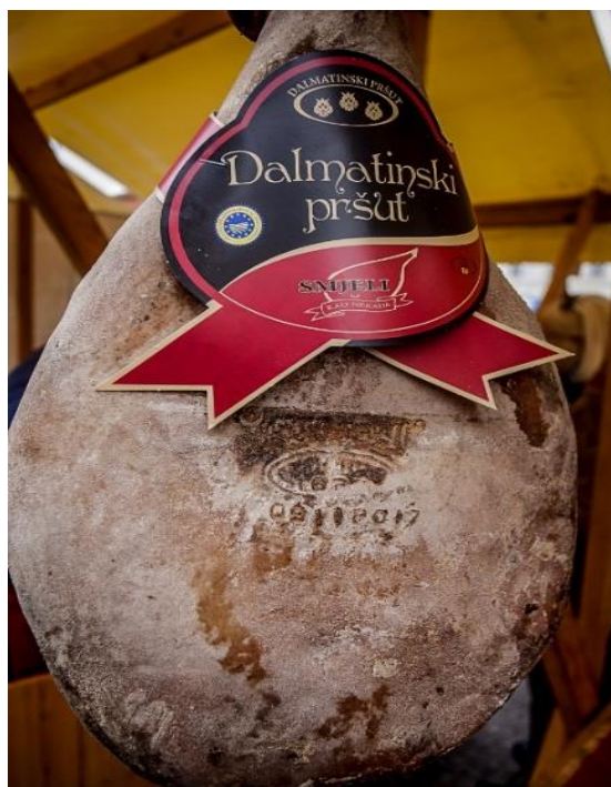
Slika 1. Dalmatinski pršut (Ralica, 2019)