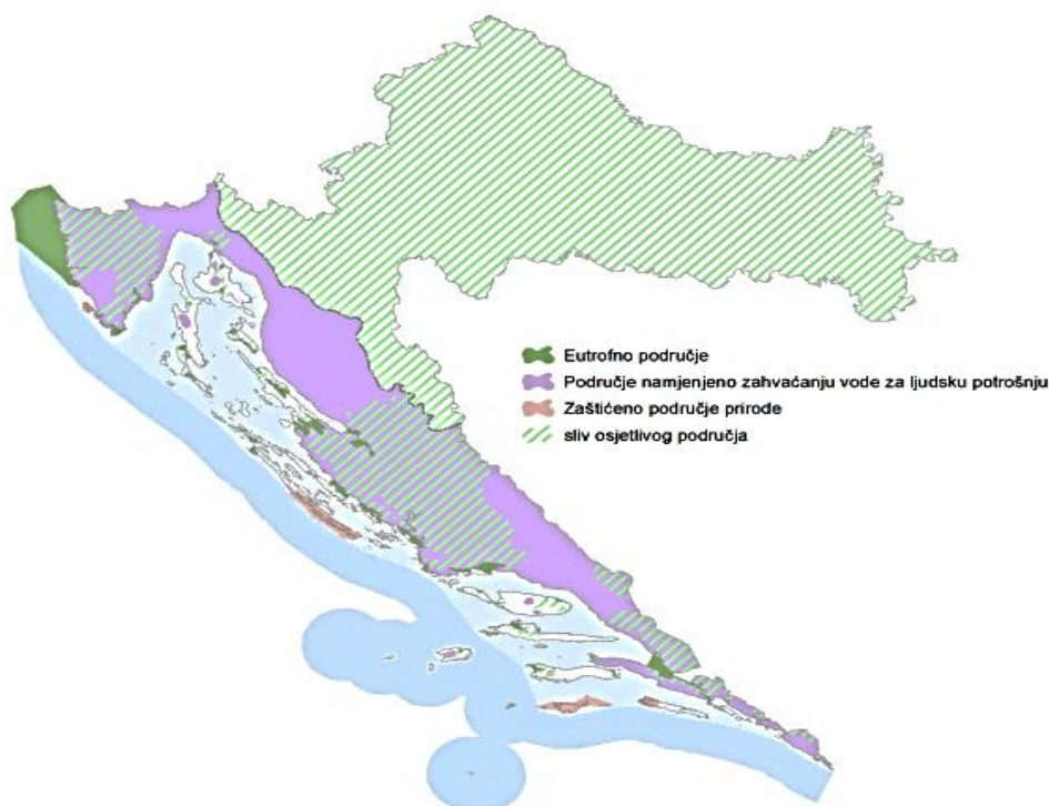
Slika 3. Pregledna karta osjetljivih područja i njihovih slivova