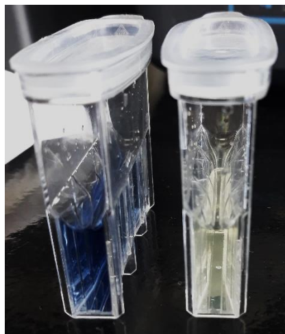
Slika 6. Određivanje ukupnog fosfora – obojenje uzorka i slijepe probe u 50 mm kiveti prije mjerenja na spektrofotometru

Prvo se provodio Crack-Set 10 test prema uputstvima priloženim uz test, a zatim se provodio fosfatni test prema priloženim uputstvima (slka 6). Koncentracija ukupnog fosfora mjerila se pomoću spektrofotometra Hach DR3900 pri 690 nm.