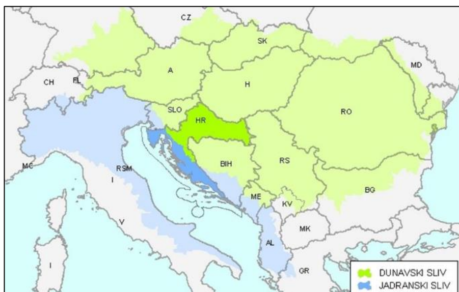
Slika 1. Prikaz regionalne hidrološke podjele Hrvatske

Prema Hrvatskim vodama (2016) u Republici Hrvatskoj nalazi se oko 67500 kilometara kopnenih tekućica, 167,1 km 2 kopnenih stajaćica te oko 161 km 2 prijelaznih voda.