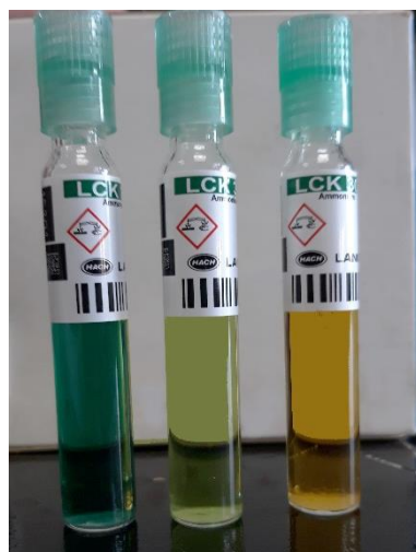
Slika 5. Određivanje amonijevih iona s razvojem obojenja otopine

Dodalo se 5 mL uzorka u staklenu kivetu pomoću automatske pipete, zatvorilo se kapicom okrenutom naopako te se sadržaj kivete dobro promućkao. Nakon 15 minuta mirovanja u uzorku se odredila koncentracija amonijevih iona pomoću spektrofotometra Hach DR3900 pri 690 nm.