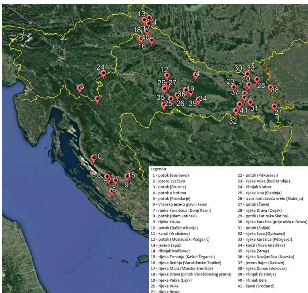
Slika 4. Prikaz lokacija sa kojih su uzimani uzorci vode

Uzorci vode su uzeti sa ukupno 41 lokacija (slika 4) diljem Hrvatske. Najviše uzoraka (34 uzorka) uzeti su sa vodnog područja rijeke Dunav, dok je manje uzoraka prikupljeno na jadranskom vodnom području.