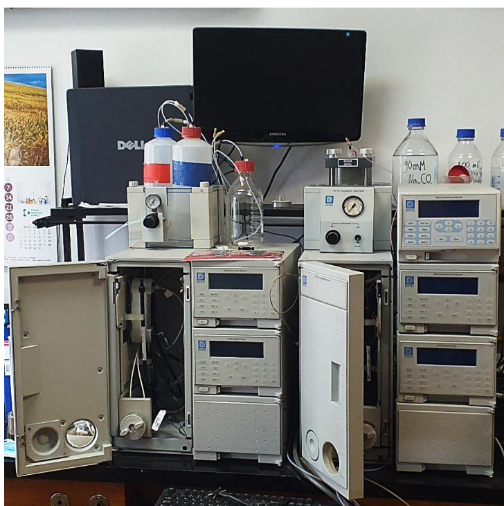
Slika 7. Dionex - DX 500 (vlastita fotografija)

U ovom eksperimentu koristio se uređaj Dionex DX – 500 (Slika 7). Uređaj sadrži anionsku predkolonu Dionex IonPac AG9-HC, anionsku kolonu Dionex IonPac AS9-HC, kationsku predkolonu Dionex IonPac CG12A, kationsku kolonu Dionex IonPac CS12A, konduktometrijski detektor CD20 u kombinaciji sa elektrokemijskim supresorom, generator eluensa EG40, visokotlačnu pumpu IP25 te sustav za uzimanje uzorka AS40.