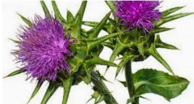
Slika 6. Sikavica ( Silybum marianum ) (Carin, 2020)

(slika 6). Sikavica je jedna od najboljih biljaka za detoksikaciju i zaštitu jetre, a vodi se u Crvenoj knjizi vaskularne flore Hrvatske kao gotovo ugrožena vrsta (Nikolić i Topić, 2005).