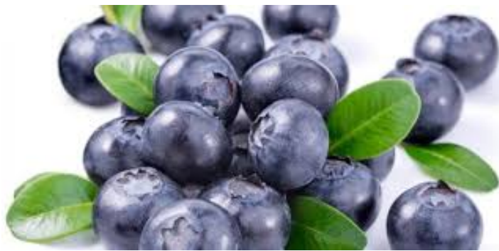
Slika 10. Borovnica ( Vaccinium myrtillus L.), (Anonymus 9, 2020)

Borovnica je mali višegodišnji grm koji ima bobičaste plodove i pripada porodici Ericaceae (slika 10).