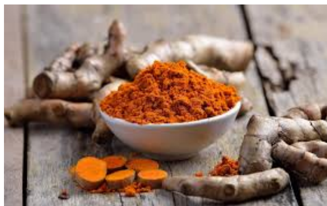
Slika 8. Kurkuma ( Curcuma longa ) (Anonymus 7, 2020)

Kurkuma (turmerik, indijski šafran) biljna vrsta iz porodice đumbirovki ( Zingiberaceae ) od čijeg se korijena biljke dobiva istoimeni začin aromatičnog ljuto-žarećeg, blagog gorkog i smolastog okusa (slika 8).