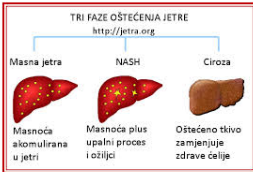
Slika 2. Faze oštećenja jetre (Anonymus 2, 2020)