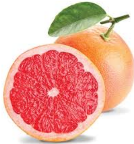
Slika 4. Grejp ( Citrus paradisi ) (Anonymus 4, 2020)

protuupalno, antioksidativno i antivirusno sredstvo, kao kozmetička otopina i kao sredstvo za konzerviranje (Madrigal-Santillan i sur., 2013).