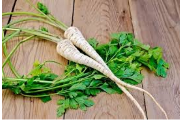
Slika 11. Peršin ( Petroselinum crispum ), (Anonymus 10, 2020)