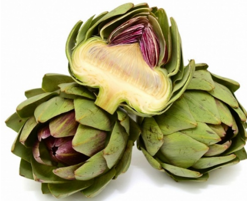
Slika 7. Artičoka ( Cynara cardunculus var. scolymus ), (Anonymus 6, 2020)

Artičoka je višegodišnja biljka, no uzgaja se i kao jednogodišnja (slika 7). Korijen je dubok i razgranat, lancetasto lišće na sebi ima dlačice i bodlje i čini rozetu, a cvjetovi su skupljeni u cvat i svijetlo ljubičaste su boje (Lešić i sur., 2002).