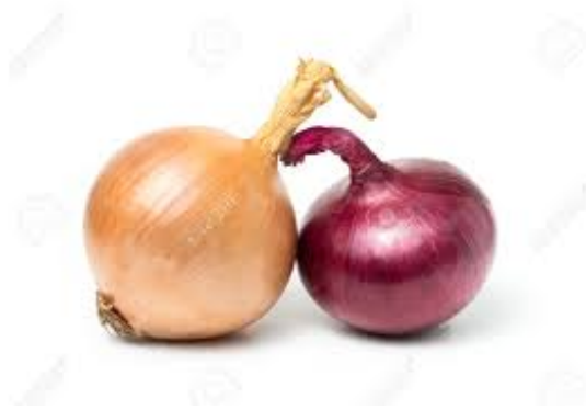
Slika 9. Crveni luk ( Allium cepa L.), (Anonymus 8, 2020)

U modernoj biljnoj medicini koristi se luk za hiperkolesterolemiju i hipertenziju (Kumar i sur., 2015), a luk je inače od davnina poznat i priznat prirodni antibiotik i antipiretik, zahvaljujući sinergijskom djelovanju vitamina C, kvercetina i izotiocijanata.