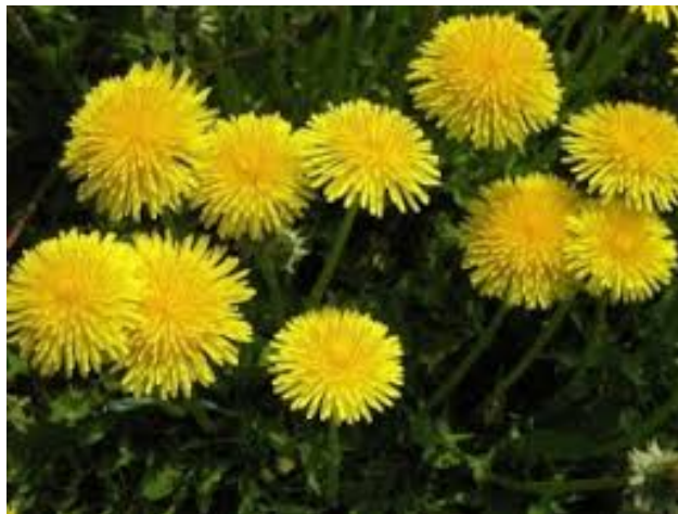
Slika 5. Maslačak ( Taraxacum officinale Weber), (Anonymus 5, 2020)

Maslačak se danas sve više koristi u narodnoj medicini i fitoterapiji. Istraživanja su potvrdila da maslačak pokazuje i antivirusna i antibakterijska svojstva.