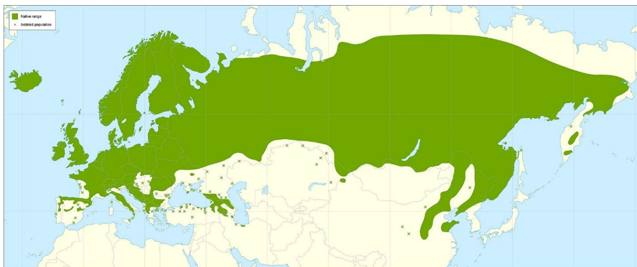
Slika 5. Areal jarebice na području Euroazije (Caudullo i sur., 2017).

granica definirana prisutnošću divljači koja se hrani plodovima jarebice (Pigott, 1983). Zahvaljujući sposobnosti podnošenja raznih uvjeta, široko je rasprostranjena bez potrebe za kultivacijom.