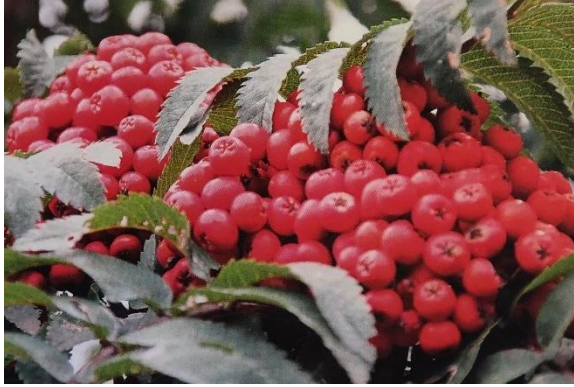
Slika 4. Crveni plodovi sorte 'Fastigiata' (Drvodelić i sur., 2019)

Sorbus aucuparia var. edulis specifičan je varijetet zbog jestivih plodova kod kojih izostaje gorki okus zbog vrlo niskog udjela parasorbinske kiseline (6-metil-5,6-dihidro-2H-piran-2-on) , a vrlo je niskih zahtjeva pri rastu, to jest podnosi vjetar, sušu, razne vrste tla, mraz, djelomično zasjenjivanje pa čak i zagađen gradski zrak. Dvije najistaknutije sorte tog varijeteta su 'Rosina' te 'Konzentra' koje sadrže 80-150 mg vitamina C/100 g ploda odnosno 160-300 mg vitamina C/100 g ploda (Drvodelić i sur., 2019).