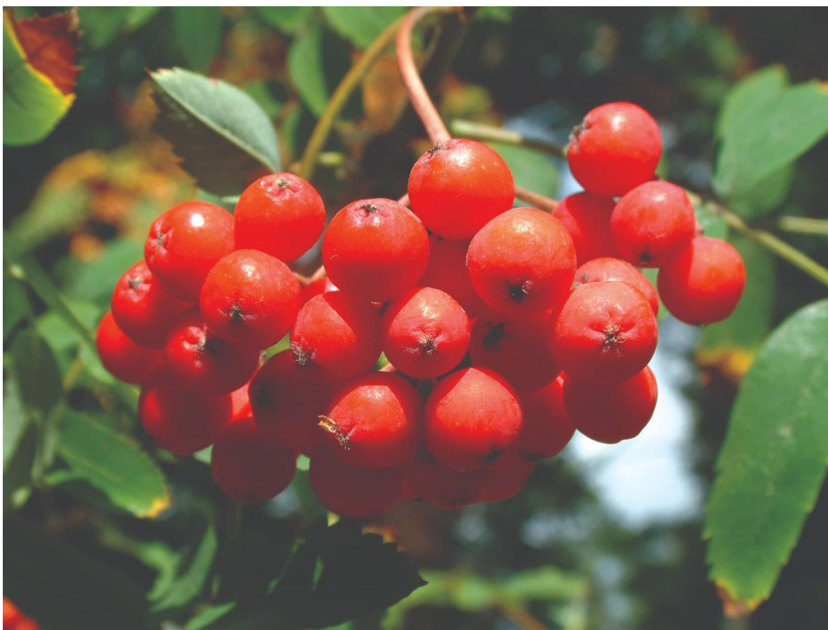
Slika 2. Zreli plodovi jarebike (Drvodelić i sur., 2019)

Listovi su neparno perasti te ih čini 9-15 ušiljenih, na vrhu napiljenih listića duljine 2-5 cm, dok je donja trećina lista cijelog ruba. Listovi su odozgo tamnozeleni, a odozdo su pustenasti. Cvjeta od travnja do svibnja. Cvatovi su poluokrugli, promjera 10-15 cm, a cvjetovi su sitni, bijele boje, dvospolni te imaju tučak s uglavnom tri, a maksimalno 5 vratova s prašnicima duljine latica (Drvodelić i sur., 2019).