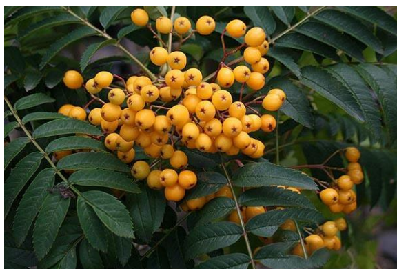
Slika 3. Žarko žuti plodovi sorte 'Sunshine' (Anonymous 1, 2021)

Sorbus aucuparia 'Fastigiata' (slika 4) ukrasna je sorta koja raste u visinu od 7 do 8 m većinom na pjeskovitom tlu, no može rasti i na drugim tlima, dok god nemaju previše vlage. Daje tamnocrvene plodove (Drvodelić i sur., 2019).