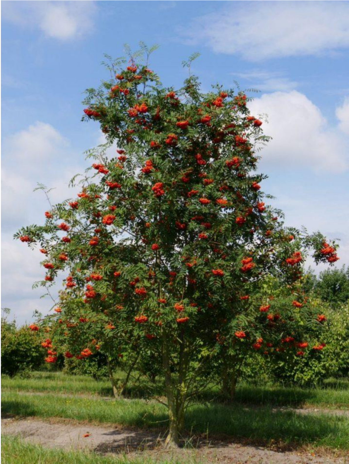
Slika 1. Stablo jarebice sa zrelim sjajnocrvenim plodovima (Anonymous 1, 2021)