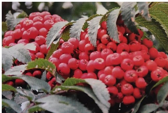
Slika 4. Crveni plodovi sorte 'Fastigiata' (Drvodelić i sur., 2019)

Sorbus aucuparia var. edulis specifičan je varijetet zbog jestivih plodova kod kojih izostaje gorki okus zbog vrlo niskog udjela parasorbinske kiseline (6-metil-5,6-dihidro-2H-piran-2-on) , a vrlo je niskih zahtjeva pri rastu, to jest podnosi vjetar, sušu, razne vrste tla, mraz, djelomično zasjenjivanje pa čak i zagađen gradski zrak. Dvije najistaknutije sorte tog varijeteta su 'Rosina' te 'Konzentra' koje sadrže 80-150 mg vitamina C/100 g ploda odnosno 160-300 mg vitamina C/100 g ploda (Drvodelić i sur., 2019).