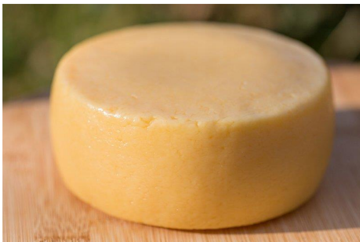
Slika 2. Krčki sir (Anonymus 2, 2021)