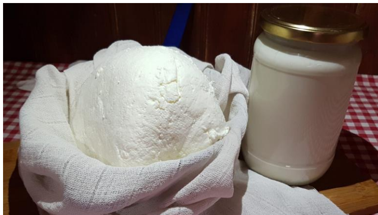
Slika 10. Svježi sir i kiselo vrhnje (Anonymus 10, 2021)

Svježi kravljji sir nema definiran oblik ni težinu, a tekstura mu je grudasta. Mliječno bijele je boje te granulirane, nježne i mekane konzistencije. Ugodnog je i izraženog mirisa i kiselog, izraženog i mliječnog okusa (Kalit, 2015).