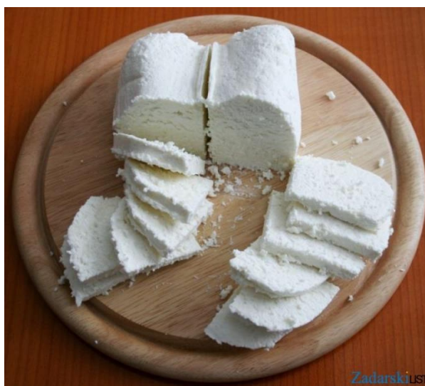
Slika 7. Paška skuta (Anonymus 7, 2021)

provodi na jedan od prethodno navedenih načina (Antunac i sur., 2011; Barukčić i Tudor Kalit, 2019). Prema udjelu suhe tvari i masti u suhoj tvari, skuta pripada skupini mekih punomasnih sireva. Sastavi Bračke, Paške i Istarske skute pomalo se razlikuju, najviše zbog različitih vrsta ovaca od kojih se dobiva mlijeko za sir (Barukčić i Tudor Kalit, 2019). Rako i sur. (2016.) utvrdili su da je udio suhe tvari u Bračkoj skuti prosječno 41,34 g/100g, udio masti 27,87 g/100g, a udio proteina 10,94 g/100g. Antunac i sur. (2011) proučavali su Istarsku i Pašku skutu te su došli do zaključka da je u Istarskoj skuti udio suhe tvari 56,62 g/100g, masti 28,90 g/100g te proteina 10,84 g/100g, dok u Paškoj skuti ti udjeli iznose 36,97 g/100g, 23,25 g/100g i 11,11 g/100g.