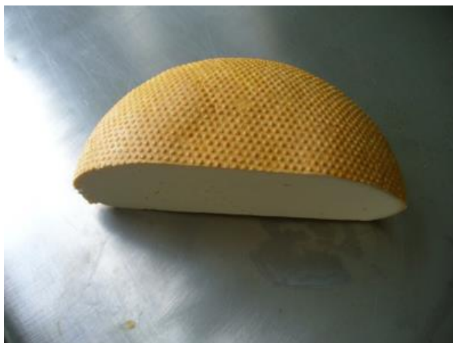
Slika 12. Tounjski sir (Anonymus 12, 2021)