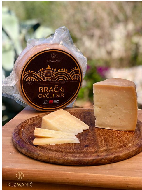
Slika 3. Brački sir (Anonymus 3, 2021)

Kemijski sastav Bračkog sira ovisi o mnogim faktorima kao što je kvaliteta mlijeka ili pak duljina procesa sazrijevanja te s obzirom na to može varirati. Brački sir kojemu je proces sazrijevanja trajao 3 mjeseca prosječno na 100 g sira sadrži 66,08 g suhe tvari, 25,62 g proteina, 33,78 g masti te 2,05 g soli, a pH vrijednost mu je 5,16 (Barukčić i Tudor Kalit, 2019).