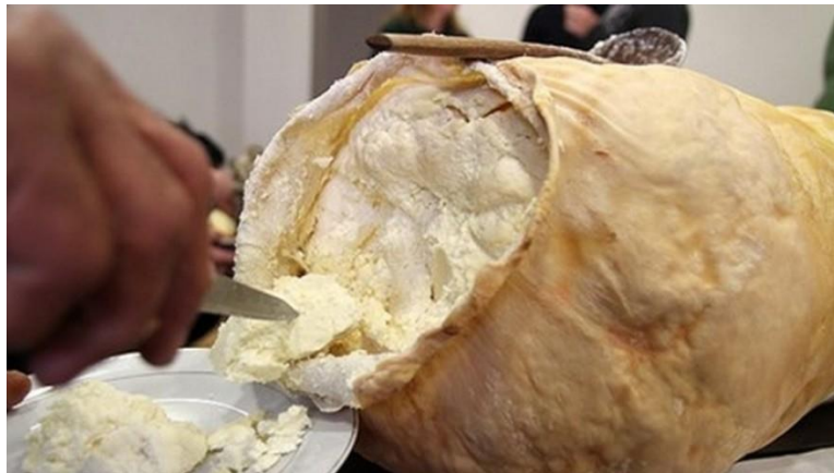
Slika 9. Sir iz mišine (Anonymus 9, 2021)

Zbog specifičnih biokemijskih procesa do kojih dolazi prilikom zrenja u mišini, sir iz mišine ima jedinstven, intenzivan i pikantan okus. Boja mu je bijelo-žućkasta, ima tvrdi teksturu i nema koru ( Barukčić i Tudor Kalit, 2019).