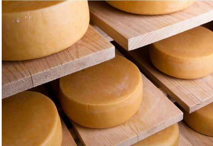
Slika 5. Lečevački sir (Anonymus 5, 2021)