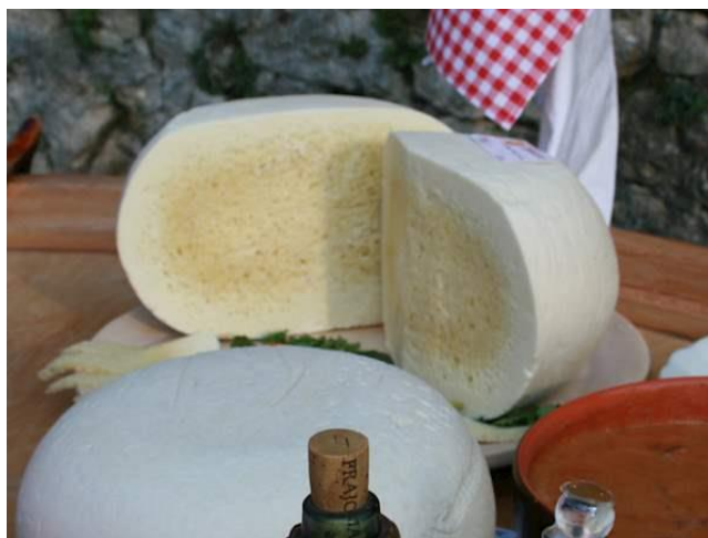
Slika 14. Grobnički sir (Anonymus 14, 2021)