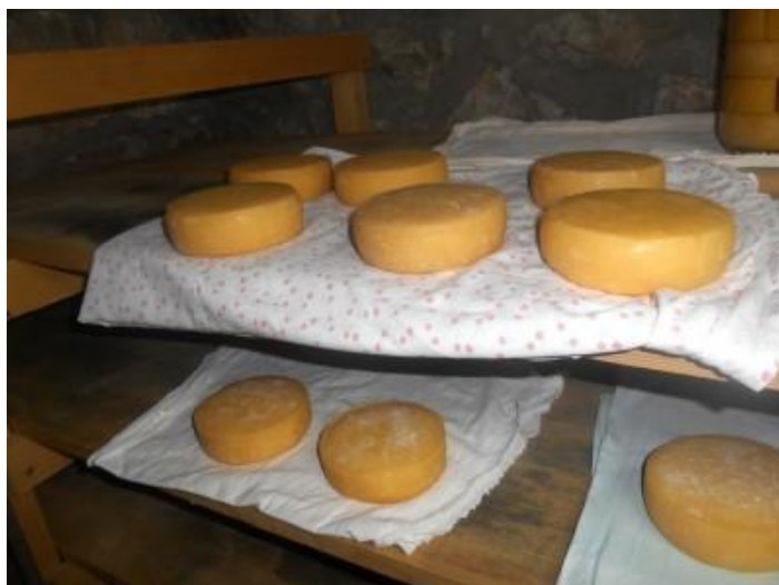
Slika 6. Dubrovački sir (Anonymus 6, 2021)