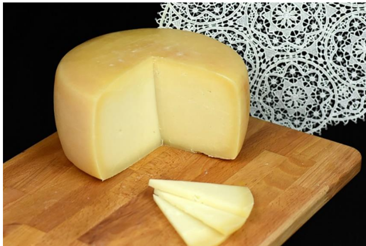
Slika 1. Paški sir (Anonymus 1, 2021)

Tako dobiveni sir cilindričnog je oblika, s ravnim dnom i lagano konveksnim plaštem. Promjer mu je od 18 do 24 cm, visina od 7 do 13 cm, a teži od 1,8 do 3,5 kg, ovisno o dimenzijama. Što se tiče kemijskog sastava, Paški sir mora sadržavati najmanje 55 % suhe tvari od koje najmanje 45 % moraju biti masti. Sir je iznutra blijedo žute boje, kompaktn i lako se reže, dok je kora glatka i tvrda, zlatnožute do svijetlocrvenkasto- smeđe boje. Okus je slatkast i blago pikantan (s duljim zrenjem je sve izraženiji), a miris je tipičan za ovčje sireve uz primjesu mirisa aromatičnih trava (Barukčić i Tudor Kalit, 2019; Udruga proizvođača Paškog sira otoka Paga, 2018).