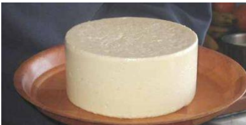
Slika 8. Sir škripavac (Anonymus 8, 2021)