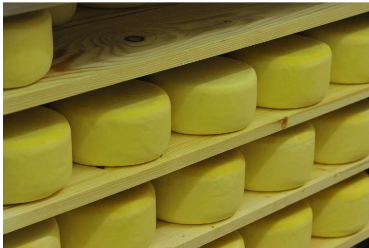
Slika 4. Istarski sir (Anonymus 4, 2021)

Istarski sir je, kao i svi dosad opisani, cilindričnog oblika. Promjer mu iznosi između 18 i 24 cm, visina od 7 do 9 cm, a težina mu može varirati od 2 do 10 kg (Barukčić i Tudor Kalit, 2019). Smije sadržavati do 56 % vode u bezmasnoj tvari te najmanje 45 % masti u suhoj tvari. Kora sira je zlatno- žute boje, dok mu je okus blago pikantan, izražene i specifične arome po ovčjem mlijeku (Kalit, 2015).