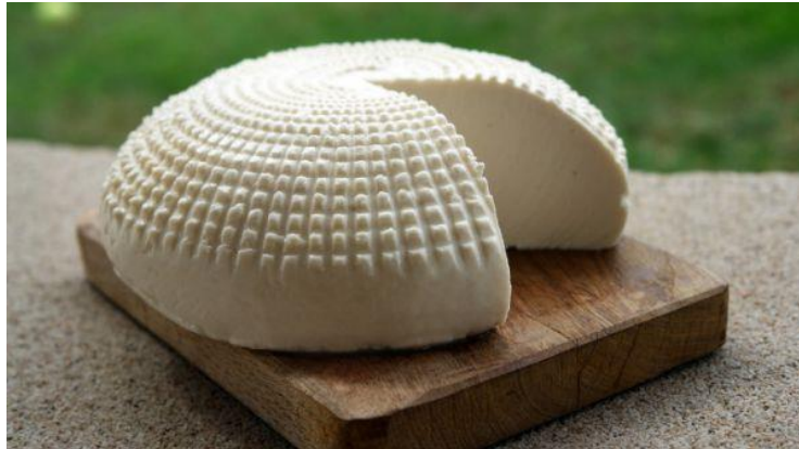
Slika 13. Preveli sir, nedimljeni (Anonymus 13, 2021)

suhoj tvari, 19,51 % proteina i 2,07 % soli. S obzirom na spomenute udjele suhe tvari i masti, Preveli sir svrstava se u meke, masne sireve.