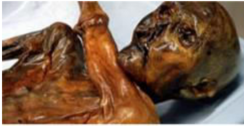
Slika 2a. Ötzi, tzv. Ledeni čovjek