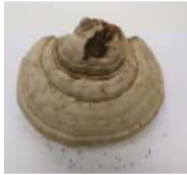
Slika 2c. Brezova guba (lat. Fomitopsis betulina )