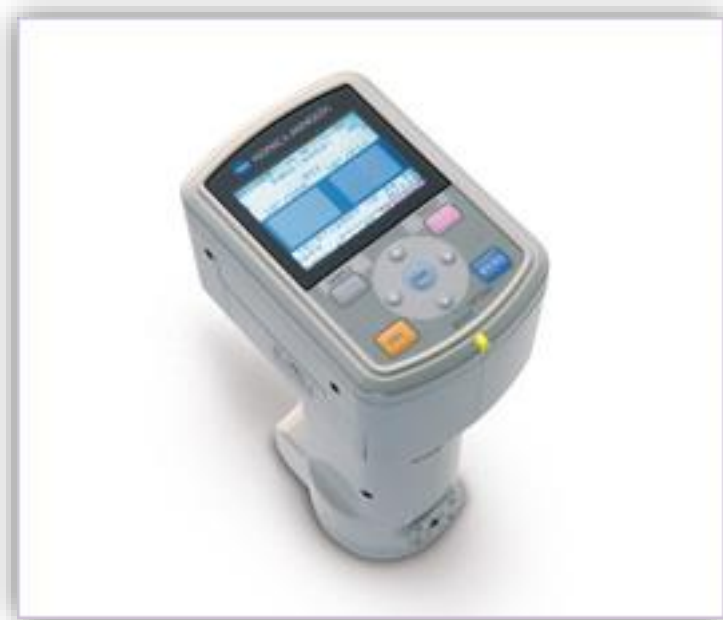
Slika 5. Spektrofotometar Konica Minolta (CM-700d, Minolta, Japan) (Anonymous 5, 2021)

Instrumentalno mjerenje boje mesa provedeno je spektrofotometrijski pomoću kolorimetra Konica Minolta CM-700d (slika 5.)(Osaka, Japan). Referentna metoda mjerenja boje mesa (Honikel, 1998) koristi trodimenzionalan L^* , a^* i b^* spektar boja. Izmjerene su L^* , a^* i b^* vrijednosti (CIE, 1976). Svaka prikazana vrijednost predstavlja srednju vrijednost od deset mjerenja po uzorku. Boja je mjerena na način da se pokušavalo izbjeći zone sa masnim tkivom tako da vrijednosti boje prezentiraju pravu boju mišićnog tkiva pršuta. Boja je mjerena za kontrolne uzorke pršuta pakiranog u atmosferi zraka, te za uzorke zapakirane u vakuumu u različitoj ambalaži.