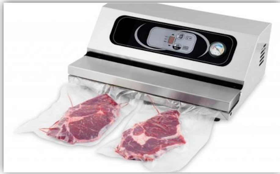
Slika 3. Uređaj za vakuum pakiranje (Lavezzini medium economy series, Promag d.o.o., Hrvatska, Anonymus 3, 2021)