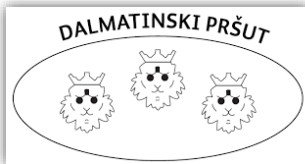
Slika 2. Grafički prikaz zajedničkog znaka „Dalmatinskog pršuta“ (Anonymus 2, 2021)

Zajednički znak „Dalmatinskog pršuta“ grafički je prikazan na slici 2. znak ima ovalni oblik pečata unutar kojeg se nalaze tri lavlje glave, a na gornjem vanjskom obodu piše „Dalmatinski pršut“. Zajednički znak „Dalmatinskog pršuta“ se po završetku faze zrenja nanosi kao vrući žig na kožu onih pršuta za koje je ovlašteno tijelo utvrdilo da su proizvedeni u skladu s ovom specifikacijom i posjeduju sva propisana fizikalno-kemijska i senzorska svojstva.