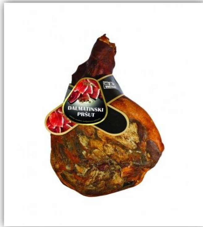
Slika 1. Dalmatinski pršut (Anonymus 1 ,2021)