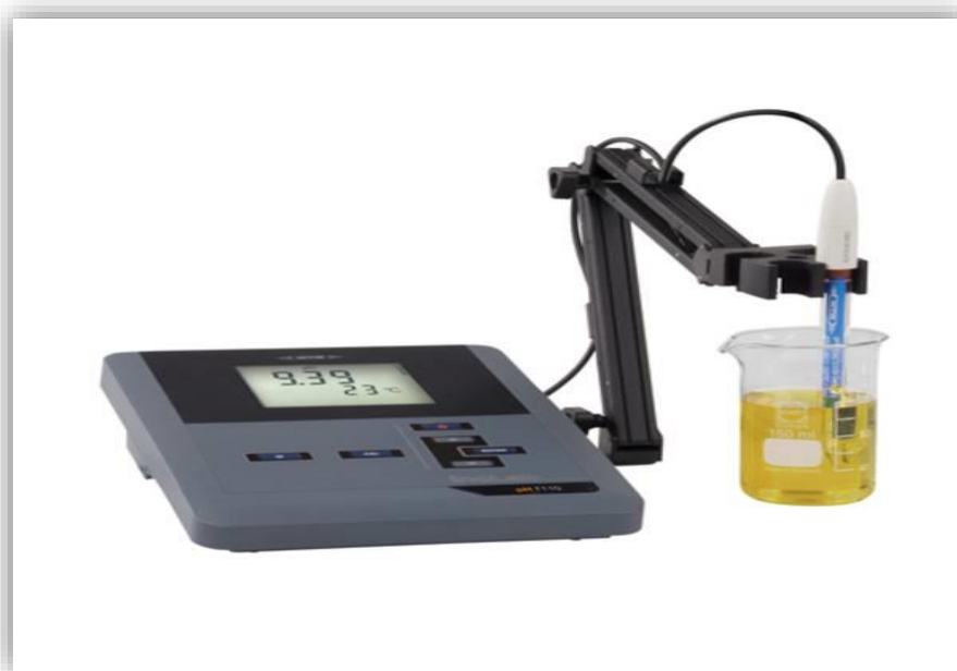
Slika 4. Uređaj za mjerenje pH (benchtop sensION tm + MM374, Hach Company, Loveland, CO, USA) (Anonymus 4, 2021)

Suspencija za određivanje pH je pripravljena miješanjem 2 g homogeniziranog uzorka pršuta sa 18 mL destilirane vode kroz 20 s u homogenizatoru (Polytron PT 10-35 GT, Kinematica AG, Švicarska). Elektroda je kalibrirana sa standardnim puferima pH 4,01 i 7,00 ekvilibriranim na 25 °C za mjerenja. pH uzoraka mjenen je u triplikatu korištenjem digitalnog pH metra (benchtop sensION tm + MM374, Hach Company, Loveland, CO, USA). Na slici 4. se nalazi slika pH metar korištenog za mjerenje pH uzoraka pršuta.