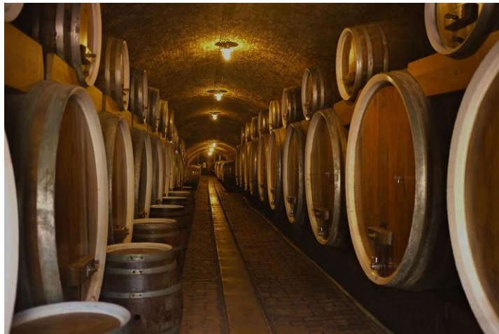
Slika 9. Vinski podrum (Zoričić, 1996)

Podrum je prostor u kojem se prerađuje grožđe, njeguje i čuva vino (Slika 9.). Prema načinu gradnje dijelimo ih na podzemne, nadzemne i kombinirane, a mogu biti prerađivački, dorađivački i prerađivačko-dorađivački. Kao što i proces proizvodnje vina dijelimo na određene faze, tako i podrum mora imati odvojene prostore za svaku od tih faza. Podrum je preporučljivo podijeliti na barem dva osnovna dijela – dio za primanje i preradu grožđa te vrenje mošta ili masulja i na dio za njegu i čuvanje vina. Treba uzeti u obzir i poseban prostor za pranje boca i punjenje vina u boce. Pod u podrumu mora biti betonski, a zidovi obloženi keramičkim pločicama ili pak oličeni vapnenim mlijekom (Zoričić, 1996).