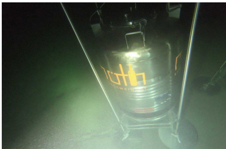
Slika 12. Spremnik od inoxa s vinom uronjen u Bodensko jezero između 2019. i 2020. (Anonimus 5, 2021)

istraživanja. Nedvojbeno je da postoje razlike u istim vinima koja su starila ispod površine vode i ona koja su starila u klasičnim uvjetima, na kopnu. No, bit će potrebno provesti brojne kemijske i organoleptičke analize kako bi se ustvrdilo kolike su te razlike te isplati li se uopće ulagati u ovakve pothvate.