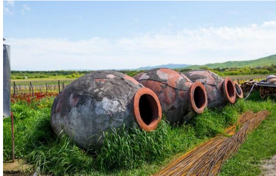
Slika 8. Gruzijски qvevri (Capece i sur., 2013)

u regiji Kakheti, proizvodnja vina temelji se na drevnoj tehnici koja uključuje amfore ili „qvevrije“ (Slika 8). Nakon tiještenja, masulj se stavlja u amfore, zakapa pod zemlju i tako u amforama fermentira 10 do 20 dana. Nakon što fermentacija završi, vino dozrijeva u amforama u kontaktu s kominom u trajanju od 3 do 4 mjeseca. Proces je jednak i za crno i za bijelo vino, što bijelim vinima daje poseban karakter, narančaste su boje i obogaćena hlapivim spojevima i spojevima arome koji potječu iz grožđa (Capece i sur., 2013).