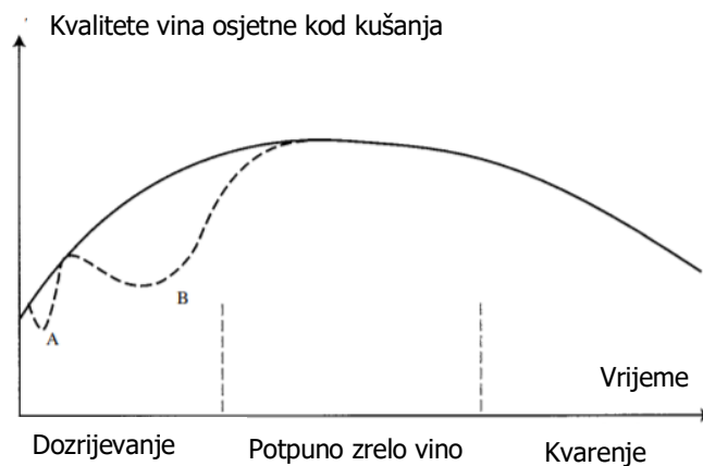
Slika 11. Tri faze starenja crnog vina (Ribéreau-Gayon i sur., 2006)

odvija bez prisutnosti kisika, smanjuje se redoks potencijal vina te nedvojbeno na promjene u vinu utječu i reakcije redukcije (Jackson, 2008). Vino je tijekom odležavanja u boci posebno osjetljivo i na temperaturu. Pri 12 °C vino se razvija sporo, no pri 18 °C promjene su puno brže (Ribéreau-Gayon i sur., 2006). Reakcije koje obilježavaju starenje vina u boci opisane kod crnog vina uključuju ranije spomenutu homogenu polimerizaciju tanina. Tu reakciju prati kondenzacija antocijanina i tanina. Raznolikost tih reakcija je moguće objašnjenje za promjene u organoleptičkim svojstvima vina tijekom prve faze procesa starenja, što je vidljivo na Slici 11.