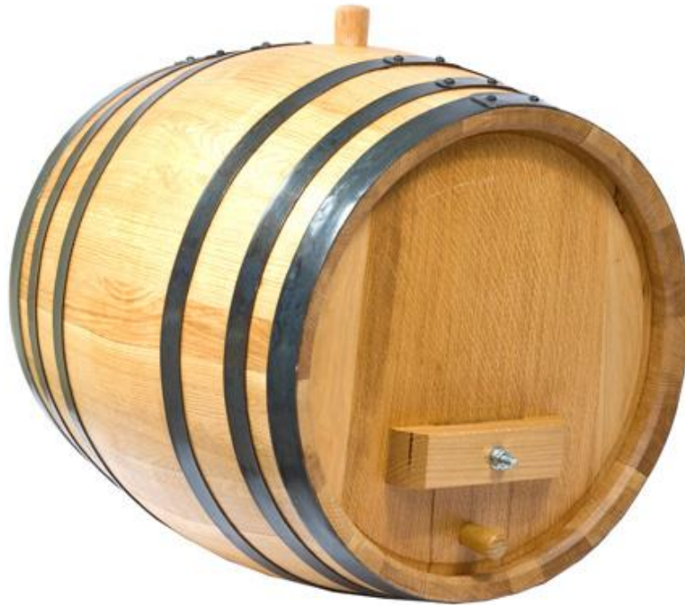
Slika 1. Hrastova bačva (Licul i Premužić, 1982)

dozrijevanja u hrastovim bačvama posebno je popularan kod proizvodnje vrhunskih vina (Jackson, 2008).