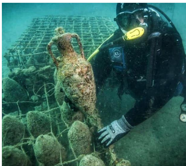
Slika 13. Amfore koje odležavaju ispod površine mora (Anonimus 6, 2021)