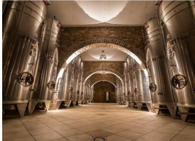
Slika 10. Vinski podrum s inox cisternama (Tomas i Kolovrat, 2014)

mora imati 18 - 20% kroma te 9 - 14% nikla, što im daje otpornost prema kiselinama. Molibden je ključni sastojak čelika za izradu cisterni u kojima će se držati vino s visokom koncentracijom sumporaste kiseline. Betonske cisterne se grade od armiranog betona i koriste se za fermentaciju, kupažiranje i čuvanje uglavnom stolnih vina. Plastične cisterne se mogu koristiti za kratkotrajno čuvanje i prijevoz vina, jer su lagane (Zoričić, 1996).