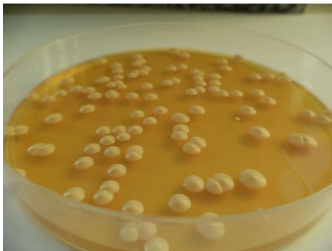
Slika 4. Kolonije kvasca roda Brettanomyces na agaru (van Wyck i Silva, 2021)

vina pa sve do spontanog bistrenja, postoje i određeni nedostaci ove tehnologije. Proces je sam po sebi dug, naime vino u bačvama dozrijeva od 3 do 5 mjeseci pa sve do 3 do 5 godina. Hrastove bačve su skupe, moraju se nakon nekog vremena zamijeniti, a u međuvremenu pravilno održavati. Nadalje, vinarije moraju imati dovoljno prostora za smještaj bačvi, jer zauzimaju puno mjesta. Poseban problem su i mikrobiološke kontaminacije koje mogu postati češće što je bačva starija. Kontaminacije dolaze i od kvasaca (Slika 4), no najneugodniji je iz roda Brettanomyces/Dekkera , koji proizvodi etilfenole i njihova koncentracija je veća u vinu koje odležava u starijim bačvama, što može imati loš utjecaj na kvalitetu vina. Ovako kontaminiranu bačvu teško je povratiti u prvotno stanje, a kontrola Brettanomyces/Dekkera kvasaca zahtijeva više od obične dezinfekcije podruma i njegove opreme. Tijekom dozrijevanja dolazi i do stanovitih gubitaka uslijed isparavanja vina što dovodi do značajnih gubitaka (Perez-Prieto i sur., 2003).