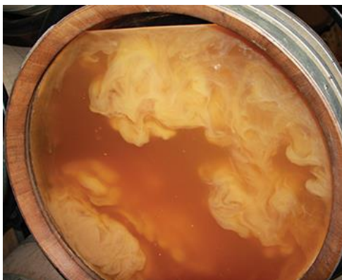
Slika 6. Vino koje dozrijeva na talogu (Smith, 2014)

Talogom se smatra ostatak koji se stvara na dnu posude s vinom nakon fermentacije, tijekom čuvanja ili nakon postupaka dozvoljenih tijekom njege vina, kao i ostatak koji nastaje nakon filtracije ili centrifugiranja. Glavninu tog taloga čine mikroorganizmi – kvasci i bakterije prisutni tijekom vinifikacije, a u manjoj mjeri tu je i vinska kiselina (Fia, 2016). Tijekom ovog procesa događa se autoliza stanica kvasca čime se u vino otpuštaju masne kiseline, nukleotidi i nukleozidi, aminokiseline i peptidi te manoproteini i polisaharidi. Sve to rezultira poboljšanjem organoleptičkih karakteristika vina. Smanjuje se trpkost i gorčina te se vino zaokružuje, bolje je strukture i dobiva kompleksniji aromatski profil. Stanice kvasca koriste kisik pa dulji kontakt vina s talogom štiti od oksidacije (del Barrio-Galán i sur., 2011). Hlapivi metaboliti kvasca mogu vinu dati voćnu aromu (Jackson, 2008), a talog uspješno uklanja etilfenole, već spomenute kao kontaminante u većim koncentracijama (Tao i sur., 2014). Najveći utjecaj na vino ima otpuštanje manoproteina. Po svojoj strukturi to su glikoproteini koji mogu stvarati kompleks s taninima te time omekšati vino. Smanjuju mogućnost stvaranja замуćenja koje potječe od proteina, te ubrzavaju završetak malolaktične fermentacije (Jackson, 2008).