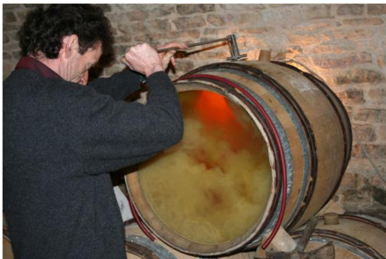
Slika 7. Resuspendiranje taloga miješanjem ( battonage ) (Ageeva i sur., 2018)

Kao neke od nedostataka ove metode Del Barrio-Galán i suradnici (2011) navode potrebu za bolje opremljenim vinarijama i više osoblja, dulje vrijeme čuvanja vina što usporava flaširanje i stavljanje proizvoda na tržište te pojavu reduktivnih nota zbog manjka kisika kojeg troše stanice kvasca. Pojava reduktivnih nota se pak može kontrolirati odvijanjem procesa dozrijevanja na talogu u barrique bačvama upravo zbog spore oksidacije koja se događa u bačvama. Druga opcija, ako vino dozrijeva na talogu u spremnicima, je kontrolirano dodavanje određenih doza kisika u vino. Također može doći do razvoja mikroorganizama kvarenja poput već spomenutih kvasaca iz roda Brettanomyces . Još jedna zanimljiva alternativa dozrijevanju na talogu kvasca je dozrijevanje vina u bačvama čije dužice nisu paljene. Na taj način u vino se također mogu ekstrahirati polisaharidi, iako ne isti kao oni iz stanica kvasca. Unatoč tome, i polisaharidi iz nepaljenih bačava mogu vinu dati slađe arome i punoću te poboljšati okus u ustima, a istovremeno smanjiti trpkost i gorčinu (Ageeva i sur., 2018).