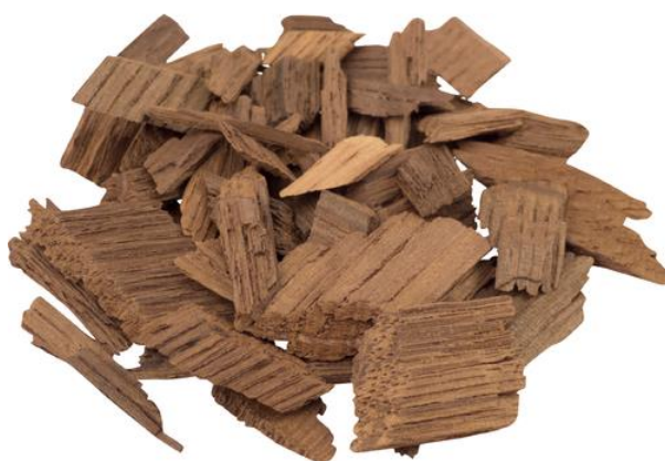
Slika 5. Hrastove strugotine korištene za dozrijevanje vina (Anonimus 3, 2021)

ekstrakcije spojeva iz drva je brža nego kod dozrijevanja u bačvama. Rubio-Bretón i suradnici (2018) uspoređivali su sastav crnog vina koje je dozrijevalo u hrastovoj bačvi kao i u spremnicima s hrastovim strugotinama te s dužicama hrasta. Najbolja organoleptička svojstva vina koje je dozrijevalo s dužicama dobivena su već nakon kratkog vremena, dok je za najbolje rezultate u bačvama bilo potrebno nešto više vremena. Najslabiji rezultat pokazala su vina dozrijevana s hrastovim strugotinama. Moguća je upotreba ovog načina dozrijevanja vina za ona vina za koja ionako nema potrebe za predugim dozrijevanjem, dok je dozrijevanje u hrastovim bačvama ipak nezamjenjivo za vina pogodna za dugo odležavanje.