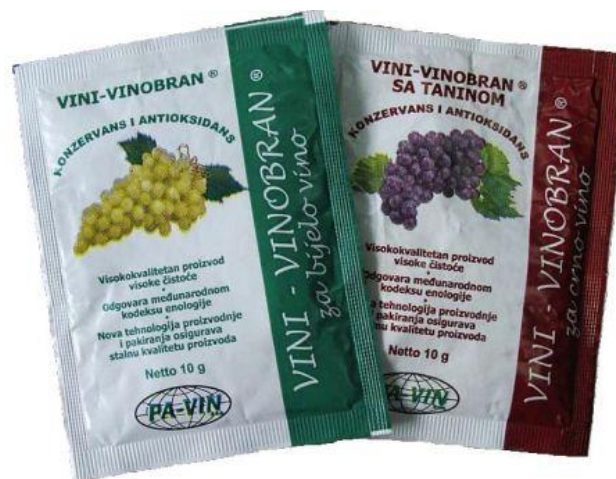
Slika 1. Vinobran (Anonimus, 2022)

Prije upotrebe, vinobran se otopi u vinu ili zakiseljenoj vodi kako bi se kalij vezao na kiselinu, a sumporni dioksid oslobodio (Slika 1, Anonimus, 2022).