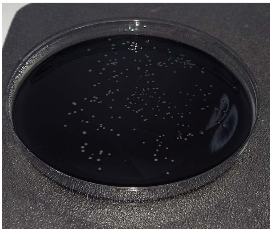
Slika 2. Prikaz dobivenih kolonija na mCCD agaru

odredio broj kolonija. Za izradu svih razrjeđenja korištena je puferirana peptonska voda. Za rast kampilobaktera korištena je selektivna podloga mCCDA (engl. modified charcoal cefoperazone deoxycholate agar ) proizvođača Oxoid Ltd, Basingstoke, UK. Podloge koje su korištene u svrhu određivanja broja Campylobacter spp. kao i puferirana peptonska voda pripremljene su prema uputama proizvođača. Kako bi se odredio broj kolonija po gramu uzorka (CFU/g), svaki uzorak je rađen uzastopce u seriji od pet razrjeđenja u omjeru 1:10, od 10^{-1} do 10^{-5} . Svako razrjeđenje naciepljeno je po 0,1 mL na mCCD agaru u dvostrukom postupku te razmazano kružnim pokretima sterilnim L – štapićem. Nakon toga naciepljene ploče stavljene su u posude sa GENbox microaer vrećicom (proizvođač Biomerieux, Francuska) za postizanje mikroaerofilnih uvjeta sa približno 10% CO 2 , 5% O 2 i 85% N 2 i u termostatu na temperaturu od 41,5° kroz 40-48 h. Nakon inkubacije sukladno metodi za određivanje broja izbrojane su karakteristične kolonije. Tipične kolonije na mCCD agaru su sivkaste, glatke, vlažne, sjajne, plosnate, često nepravilnog rasta (slika 2). Svaka odabrana karakteristična kolonija naciepljena je na Columbia agar s dodatkom 5% defibrinirane ovčje krvi (Biognost, Republika Hrvatska) i inkubirana u mikroaerofilnim uvjetima na temperaturi od 41,5 °C tijekom 18-24 sati.