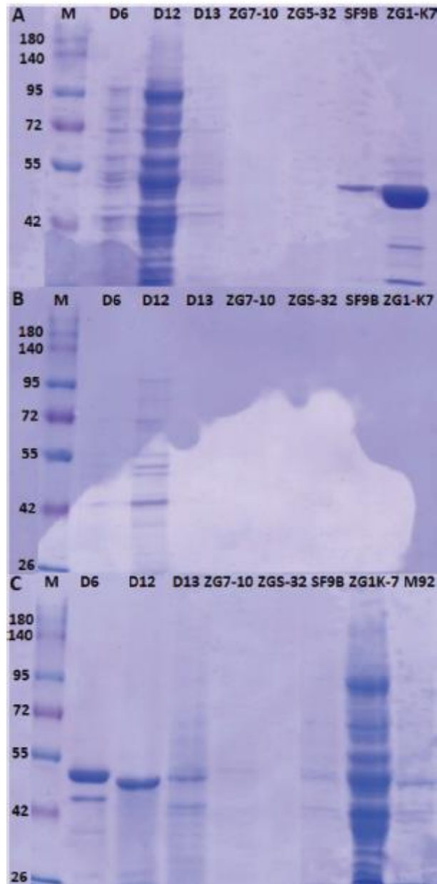
Slika 2. SDS-PAGE potencijalnih proteinaza izoliranih sojeva bakterija mliječne kiseline L. brevis D6, L. fermentum D12, L. plantarum D13, Lc. lactis ZGZA7-10, Lc. lactis ZGBP5-32, L. brevis SF9B i L. brevis ZG1-K7, iz uzoraka A) taloga proteina, B) supernatanta ekstrakta proteina i C) supernatanta ekstrakta proteina nakon ultrafiltracije

Postupak ekstrakcije nije primjenjiv za detekciju proteina iz Lc. lactis budući da proteinske vrpce nisu otkrivene niti u uzorku peleta niti u supernatantu proteinskih ekstrakta (slika 2). Proteinski ekstrakti L. brevis D6, L. fermentum D12 i L. plantarum D13 sadržavali su proteine različitih molekularnih masa izolirane iz peleta ili supernatanta (slika 2A i 2B) pa je potrebna optimizacija protokola s ciljem uklanjanja nečistoća. Kako bi se to moglo postići, proteini su pročišćeni ultrafiltracijskom membranom s graničnom vrijednosti od 100 kDa. Ultrafiltracijom je uklonjen