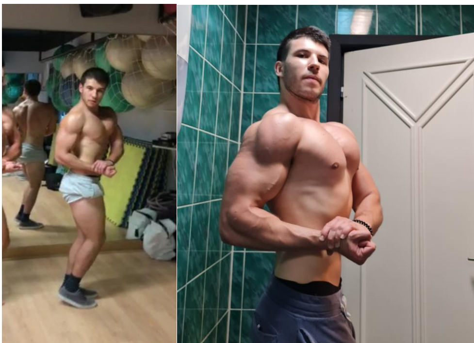
Slika 2. Iskazivanje tijela ispitanika ovog istraživanja na treningu za natjecanje

Ispitanici uzeti za provedbu istraživanja su mladi, isključivo muški bodybuilderi. Pet ispitanika sa područja Grada Zagreba, Hrvatska, dobi od 22 do 23 godine ( 22,4 \pm 0,49 godina), koji se bave tjelovježbom u programu bodybuildera u zadnjih 4 do 6 godina ( 5,4 \pm 0,8 godina), 1,5 do 2,25 sati po treningu ( 1,75 \pm 0,32 h/dan) tj. 6 do 9 sati tjedno ( 7,15 \pm 1,18 h/tjedan); pristupilo je dobrovoljno ispitivanju. Ispitanici su tjelesne mase u rasponu od 83 do 103 kg ( 89,4 \pm 7,23 kg) (Tablica 3). Kriteriji za odabir ispitanika bili su a) mladi ispitanici studentske dobi (< 25 godina), b) bave se isključivo bodybuildingom; ne drugim srodnim sportom poput „powerlifting“ sportaša, c) zdravi su i d) ne koriste steroide i slična druga anabolička sredstva („prirodni su“). Pošto niti jedan od ispitanika u početku evaluacije nije prijavio niti jedan od zdravstvenih problema niti su ikada koristili steroide, svi su ispitanici, koji su odabrani, ostali prisutni do kraja istraživanja. 100 % ispitanika nije se pripremalo niti za kakvo natjecanje tj. pratili su program iz van natjecateljske sezone. Slika 2 prikazuje ispitanika na treningu za poziranje tj. iskazivanje vlastitog tijela.