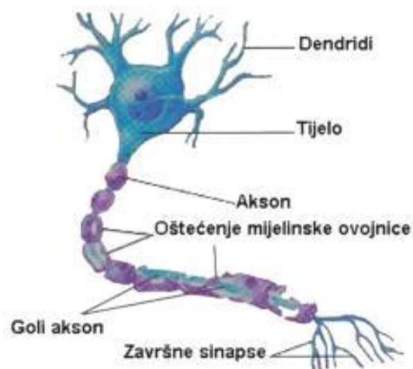
Slika 1. Prikaz neurona s oštećenom mijelinskom ovojnicom (Vedriš, 2013)

Karakteristične patološke značajke sklerotičnog plaka su demijelinizacija i oštećenje aksona. Neuron ili živčana stanica morfološki se sastoji od tijela (soma), dendrita, aksona i presinaptičkog aksonskog završetka (Slika 1). Mijelinizirani aksoni sadrže mijelinsku ovojnicu koju u središnjem živčanom sustavu izgrađuju oligodendrociti, a funkcija ovojnice je brže provođenje živčanih impulsa odnosno povećanje signalizacijske učinkovitosti aksona. Demijelinizacija predstavlja propadanje mijelinske ovojnice što posljedično dovodi do sporijeg vođenja akcijskih potencijala kroz akson, a time i do poremećaja raznih funkcija (Judaš i Kostović, 1997).