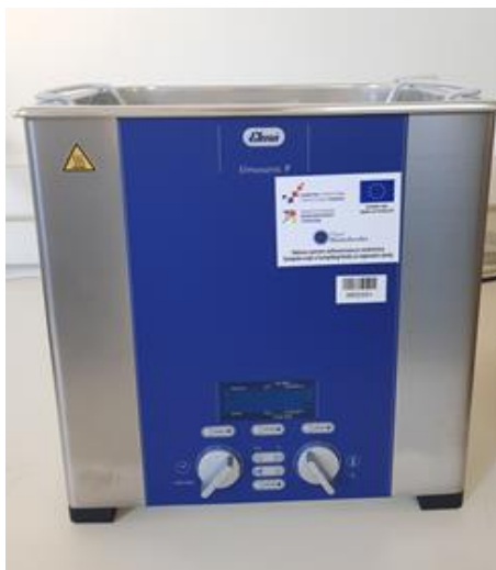
Slika 4. Ultrazvučna kupelj (Elma, Elmasonic P, Njemačka)

U Falcon kivetu se odvaži 1 \pm 0,01 g uzorka pogače pasjeg trna i doda se 40 mL 70 %-tnog etanola. Uzorci se ekstrahiraju u ultrazvučnoj kupelji (slika 4) prema navedenim parametrima temperature, snage i vremena. Dobiveni ekstrakti se centrifugiraju 15 minuta pri 4500 o/min. Slijedi filtracija (Whatman filter papir) u odmjerne tikvice od 50 mL koje se do oznake nadopune otapalom. Pripremljeni ekstrakti se skladište na +4 °C do daljnje analize.