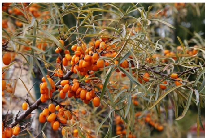
Slika 1. Plodovi pasjeg trna ( Hippophae rhamnoides L.) (Jaśniewska i Diowks, 2021)

Osim na području Europe i Azije, pasji trn raste i u Kanadi. Najčešće se uzgaja na nadmorskim visinama od 1200 do 2000 m, ali taj raspon može biti i od 2500 do 4300 m nadmorske visine (Yogendra Kumar i sur., 2013). U Hrvatskoj raste na području Podravine i Međimurja, uz rijeke Dravu i Muru, na pjeskovitom i šljunkovitom tlu. Specifičnost ove biljke je otpornost na veliki temperaturni raspon od (-) 43 °C do (+) 40 °C. Također, može rasti na izrazito slanom tlu, a podnosi i duža sušna razdoblja iako je optimalna godišnja količina padalina za rast 400-700 mm (Dong i sur., 2021).