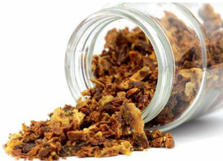
Slika 1. Propolis (Anonymous 1, 2023)

Propolis je ljekoviti proizvod pčela, karakterističan je po svojoj smolastoj konzistenciji, ugodnom mirisu i boji koja se proteže od žute do tamnosmeđe (slika 1). Riječ propolis dolazi od grčkih riječi „pro“ – obrana i „polis“ – grad, što označava obranu grada, odnosno obranu košnice. Naziv objašnjavamo tako što pčele koriste propolis za zatvaranje pukotina u košnicama, poravnavaju unutrašnje plohe zidova košnica te štite ulaz u košnicu od uljeza. Propolis služi i kao termoregulator, prekrivanjem unutrašnjih stijenka košnice propolisom, pčele se štite od visokih ljetnih temperatura i osiguravaju stalne uvjete unutar košnice. Osim toga, pčele propolisom mumificiraju manje životinje koje dospiju u košnicu i u njoj uginu te na taj način sprječavaju njihovo raspadanje unutar same košnice. Najvažnija uloga propolisa bi bila dezinfekcija stanica saća prije izlijeganja mladih pčela, na taj način se pčele unutar košnice štite od raznih bolesti (Kuropatnicki i sur., 2013).