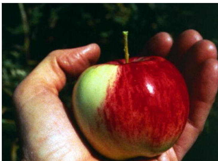
Slika 1. Malus Sieversii (Anonymous 1.)

Rod jabuke, Malus , pripada potporodici Pomoideae porodice Rosaceae . Postoji više od 30 osnovnih vrsta jabuke i većina se može lako hibridizirati (Korban 1986, Way i sur.,1991). Njezin primarni divlji predak je Malus Sieversii (slika 1) koji je smješten na granici zapadne Kine i bivšeg Sovjetskog Saveza. Kultivaciju jabuka su prakticirali stari Grci i Rimljani, te kao rezultat njihovih putovanja i osvajanja, proširile su se Europom i Azijom.