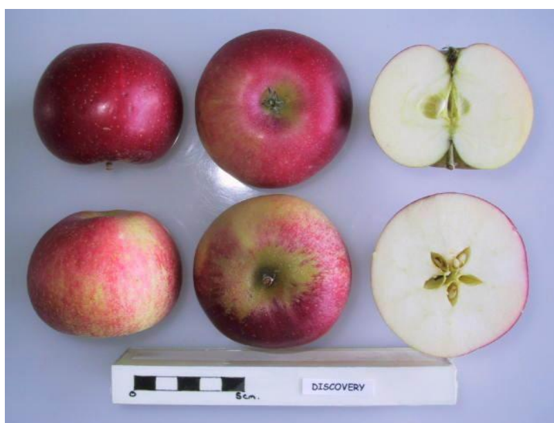
Slika 2. Sorta 'Discovery' (Anonymous 2)

Discovery (slika 2) je najpoznatija rana sorta jabuka iz Engleske. Za Discovery se često smatra da je vrlo stara sorta, ali nastala je u kasnim 1940-ima u Langhamu, Essex od sjemena Worcester Pearmain. Discovery je dakle sjemenjača Worcester Pearmaina, sorti ranih jabuka iz 19. stoljeća odakle potječe crvena boja jabuka. Dostupna je krajem kolovoza i početkom rujna.