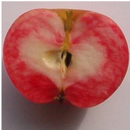
Slika 3. Crvena boja mezokarpa jabuke (Anonymous 3)

Po okusu se ne ističe previše od kasnih sorti. Okus je više kiselkast nego sladak. Poneke jabuke mogu imati okus po jagodama, iako je ta karakteristika varijabilna. Worcester Pearmain je vjerovatno izvor okusa po jagodama, koji je pronađen još u nekim sortama poput Katy, koja je po izgledu također slična Discovery sorti, ali ima jači okus i dolazi kasnije u sezoni. Jabuke su žuto – zelene boje, obično sa tamno crvenim slojevima koji nastaju od sunčevih zraka. Zanimljiva karakteristika Discovery jabuka je da ponekad crvena boja može procuriti u mezokarp ploda (slika 3).