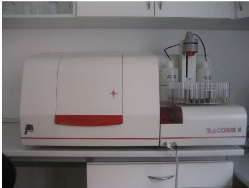
Slika 2. FTIR spektrometar, Bacchus , Microdom, Francuska (Skoog, 2007)

FTIR (Fourier transform infrared) spektroskop radi na principu infracrvenog ozračivanja ispitivanog materijala, čime mu se molekule pobude u više vibracijsko stanje. Valna duljina svjetla koju apsorbira pojedina molekula je razlika energije stanja mirovanja i energije pobuđenog vibracijskog stanja. Analiza jednog uzorka traje 30 sekundi, a za analizu je potrebno 20 mL uzorka. Uzorci su prije analize degazirani i profiltrirani. Određivani su parametri: alkohol, ukupna kiselost, hlapiva kiselost, pH, reducirani šećeri, ukupni ekstrakt, jabučna kiselina, te mliječna kiselina.