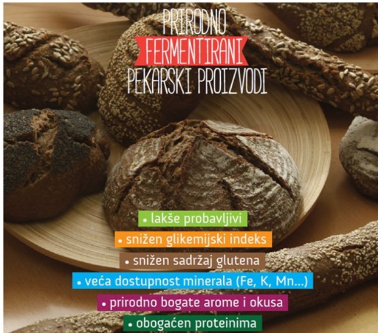
Slika 1. Dobrobiti prirodno fermentiranih proizvoda