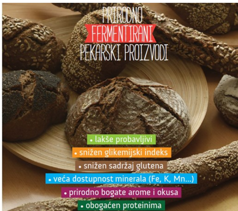
Slika 1. Dobrobiti prirodno fermentiranih proizvoda