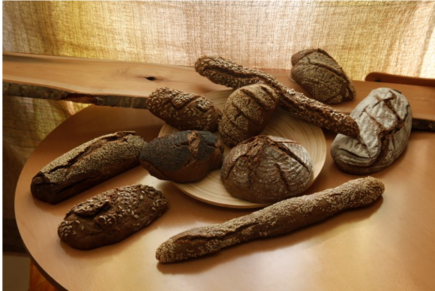
Slika 4. Pekarski proizvodi proizvedeni od brašna cijelovitih žitarica sa dodatkom prirodnog kiselog tijesta