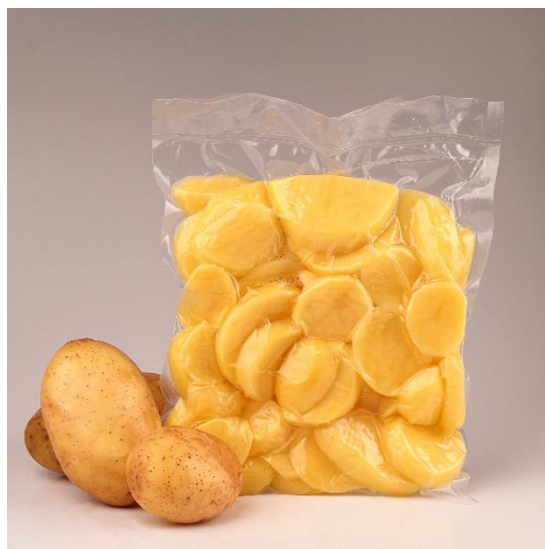
Slika 2. Minimalno procesirani krumpir (Anonymous 3, 2012)

povišene koncentracije CO 2 i/ili niske koncentracije O 2 i nisku razinu respiracije. Krumpiri također moraju zadovoljiti i kriterije kvalitete poput suhe tvari, količine reducirajućih šećera i škroba, morfološke kriterije poput oblika i veličine i organoleptičke kriterije teksture, okusa, mirisa i boje. Gomolji moraju imati pravilan oblik, bez defekata, dobrih organoleptičkih svojstava, nisku sklonost posmeđivanju i moraju biti prikladni za dugotrajno skladištenje (Rocculi i sur., 2009)