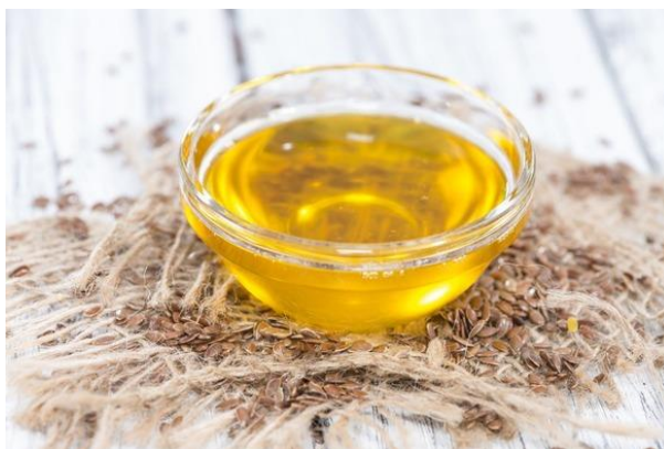
Slika 2. Laneno ulje (Anonymous 2, 2016)

Laneno ulje treba čuvati u hladnjaku do upotrebe, tj. na suhom i hladnom mjestu, a nakon otvaranja potrošiti čim prije.