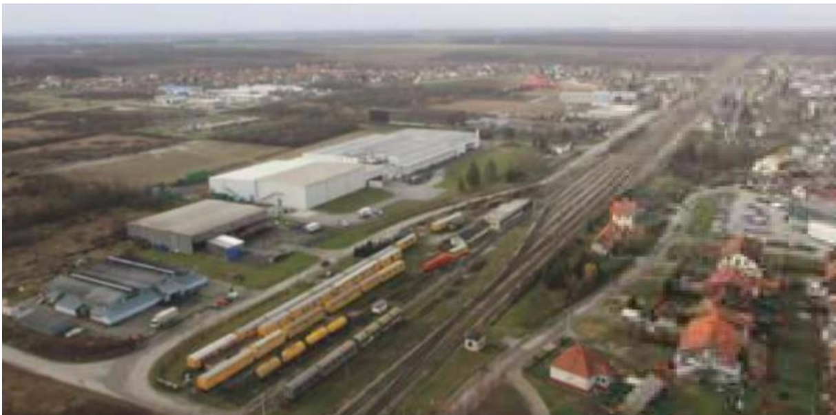
Slika 5. Poduzetnička zona Dugo Selo (Anonymus 5, 2017)

Za makrolokaciju pogona za proizvodnju hladno prešanih i nerafiniranih ulja s visokim udjelom omega-3 masnih kiselina izabrana je Zagrebačka županija, područje grada Dugo selo. Odabir ove lokacije temeljio se na dobroj prometnoj povezanosti s okolnim gradovima što olakšava dopremu sirovine u pogon. Također, pogon bi bio smješten u blizini potrošača što snizuje cijenu transporta gotovog proizvoda. Prilikom odabira lokacije vodilo se računa i da se pogon ne nalazi u blizini neke kemijske ili druge industrije koja bi imala štetan utjecaj na proizvodnju.