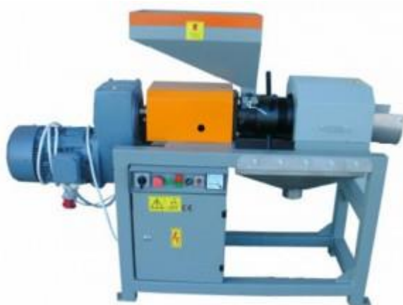
Slika 8. Pužna preša (Mojstrovina, 2017)

Temperatura sirovog ulja na izlazu iz preše je jako važna i kod hladno prešanih ulja ne bi smjela biti iznad 50^{\circ}\text{C} (Pravilnik, 2012). Prilikom kretanja materijala kroz prešu dolazi do trenja unutar samog materijala te između materijala i preše što može povisiti temperaturu materijala. Tada se prešanje mora provesti na nižem tlaku, odnosno blažim uvjetima pri čemu dobijemo manji prinos ulja jer je zaostatak ulja u pogači veći (Bockisch, 1998).