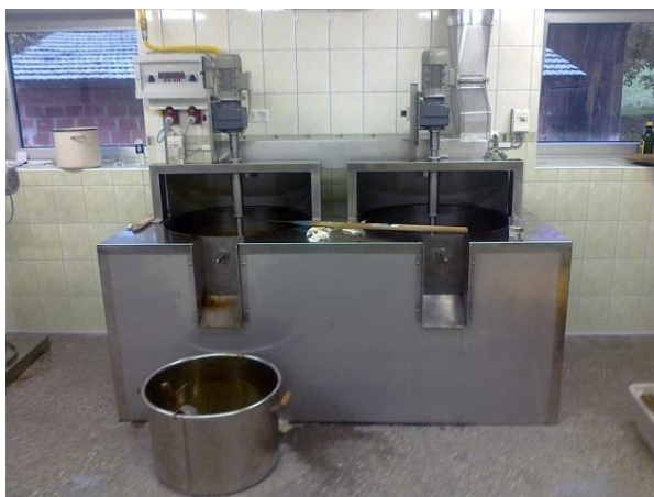
Slika 7. Pržionici (Mojstrovina, 2017)