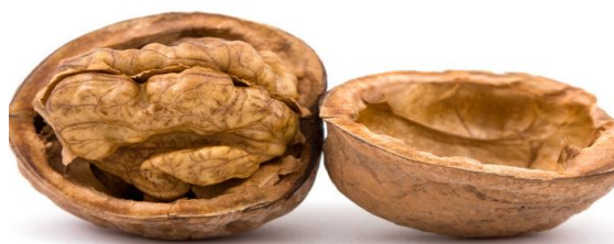
Slika 3. Orah (Anonymous 3, 2016)

Orah je bogat hranjivim tvarima, sadrži 16,7% bjelančevina, 15,9% ugljikohidrata i 66,9% masti. Visok je sadržaj nezasićenih masnih kiselina, a posebno linolne i linolenske koje su i esencijalne. Osim visokog sadržaja osam esencijalnih aminokiselina, orah također sadrži puno arginina i znatnu količinu vitamina i minerala. Od vitamina u orahu ima vitamina B kompleksa, tiamina, riboflavina, niacina, folne kiseline, vitamina E i vitamina K. Od minerala u orahu su prisutni kalcij, željezo, magnezij, fosfor, cink, bakar, mangan i selen. Od fitonutrijenata u orahu ima fitosterola posebno \beta -sitosterola (Kris-Etherton, 2014).