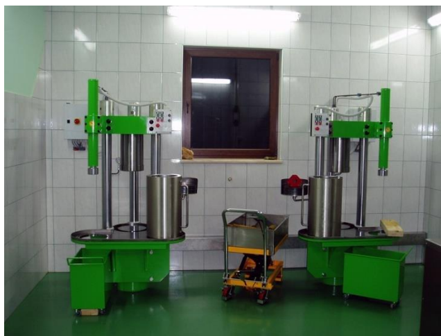
Slika 9. Hidrauličke preše (Mojstrovina, 2017)