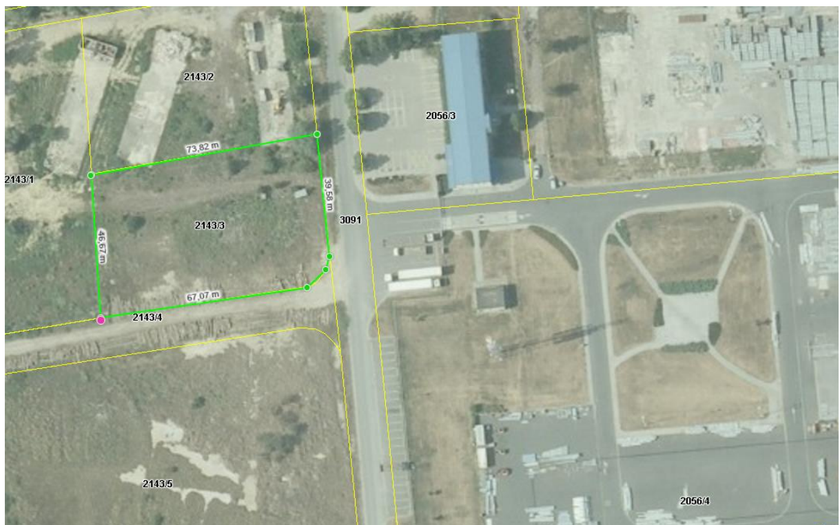
Slika 6. Mikrolokacija pogona za proizvodnju hladno prešanih i nerafiniranih ulja (Arkod, 2017)