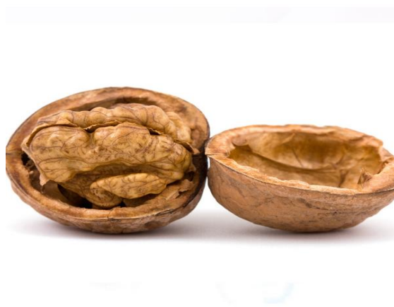
Slika 3. Orah (Anonymous 3, 2016)

Orah je bogat hranjivim tvarima, sadrži 16,7% bjelančevina, 15,9% ugljikohidrata i 66,9% masti. Visok je sadržaj nezasićenih masnih kiselina, a posebno linolne i linolenske koje su i esencijalne. Osim visokog sadržaja osam esencijalnih aminokiselina, orah također sadrži puno arginina i znatnu količinu vitamina i minerala. Od vitamina u orahu ima vitamina B kompleksa, tiamina, riboflavina, niacina, folne kiseline, vitamina E i vitamina K. Od minerala u orahu su prisutni kalcij, željezo, magnezij, fosfor, cink, bakar, mangan i selen. Od fitonutrijenata u orahu ima fitosterola posebno \beta -sitosterola (Kris-Etherton, 2014).