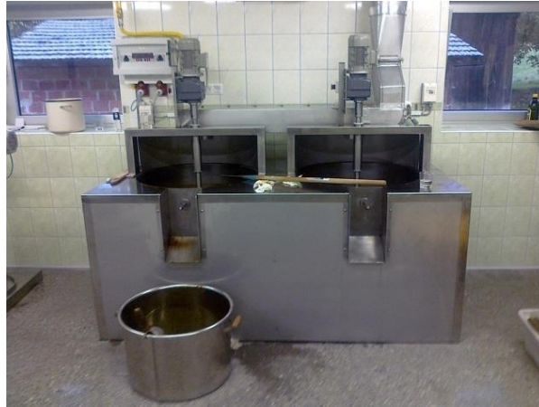
Slika 7. Pržionici (Mojstrovina, 2017)