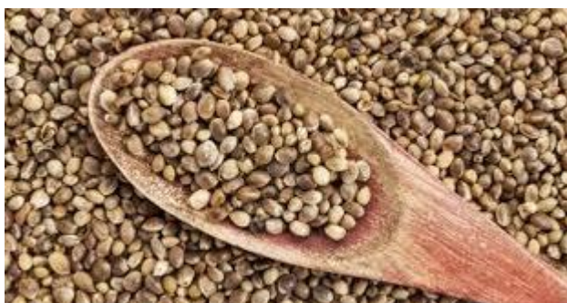
Slika 1. Sjemenke konoplje (Anonymous 1, 2017)

Prema udjelu tetrahidrokanabinola (THC) koji je glavna je psihoaktivna tvar u konoplji postoje 3 vrste konoplje: konoplja s visokim udjelom THC-a (2-6% THC-a), konoplja s manjim udjelom THC-a te konoplja za uzgoj vlakana (manje od 0,25% THC-a). Konoplja s udjelom THC-a manjim od 1% predstavlja industrijsku konoplju. Sjemenke konoplje sadrže 20-25% proteina, 20-30% ugljikohidrata, te 10-15% netopljivih vlakana, što ih čini izrazito nutritivno vrijednom hranom (Sacilik i sur., 2003). Sadrže antioksidanse, proteine, karotene, fitosterole, fosfolipide te značajan udjel minerala, uključujući kalcij, magnezij, sumpor, kalij, cink i fosfor. Jedna od vrijednih karakteristika sjemenki industrijske konoplje je i aminokiselinski sastav. Proteini industrijske konoplje, kojih u sjemenkama ima oko 25%, dobar su izvor esencijalnih aminokiselina naročito metionina i cisteina, aminokiselina koje sadrže sumpor, kao i arginina i glutaminske kiseline (Odani i Odani, 1998; Callaway, 2004). Sjemenke konoplje odlikuje ih visoki udjel ulja, 30-35% po masi sjemenke, a kod nekih vrsta i do 50% ulja (Wilkerson, 2008).