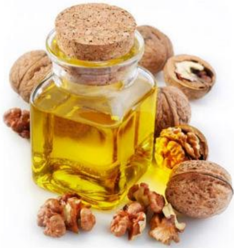
Slika 4. Ulje oraha (Anonymous 4, 2016)

Ulje oraha iznimno je bogato \omega -3 i \omega -6 esencijalnim masnim kiselinama i zato se svrstava u ulja visoke biološke vrijednosti.