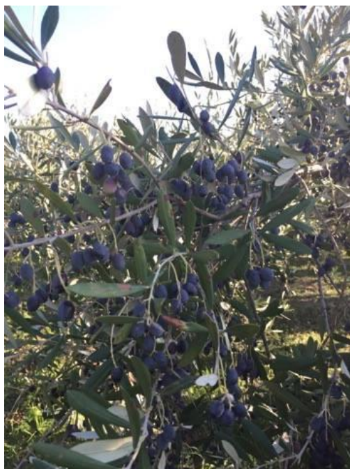
Slika 6. Plod sorte Pendolino