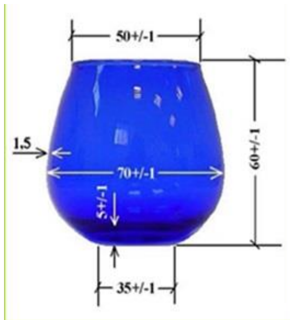
Slika 15. Čaša za senzorsku analizu djevičanskih maslinovih ulja (Koprivnjak, 2006)

Ocjenjivači ispunjavaju ocjenjivački listić, rezultati se statistički obrađuju na temelji čega se provodi kategorizacija ulja (Škevin, 2016).