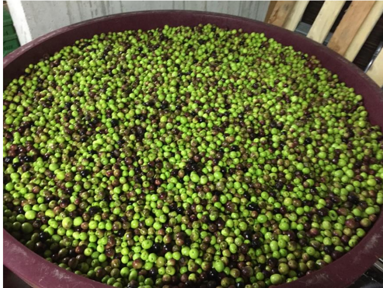
Slika 10. Čuvanje plodova maslina u slanoj vodi