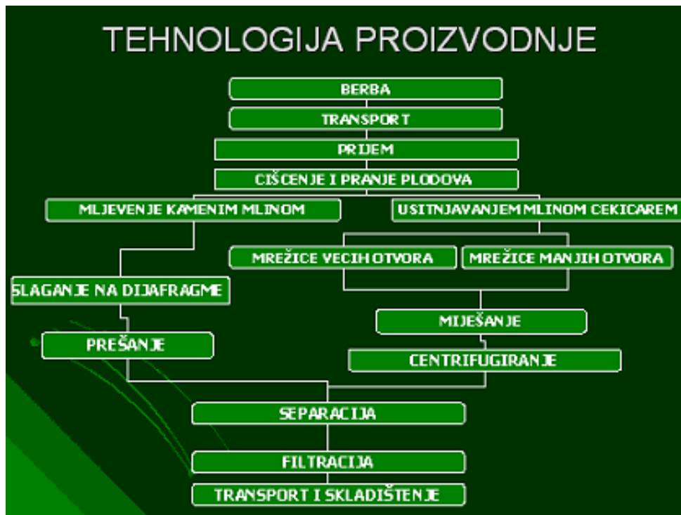
Slika 11. Tehnološki postupak proizvodnje maslinovog ulja ( http://www.pz-marina.com/products.php?sub=2 )

Prva faza u proizvodnji je čišćenje i pranje plodova. Ono se vrši na automatskim strojevima, gdje se na principu usisavanja uklanjaju grančice i listovi jer oni utječu na boju i okus ulja ako se nalaze u većoj količini. Strane nečistoće (zemlja, pijesak, kamenčići) se uklanjaju na stroju za pranje uz stalno optjecanje vode, jer ovakve primjese utječu na senzorska svojstva ulja i mogu oštetiti strojeve.