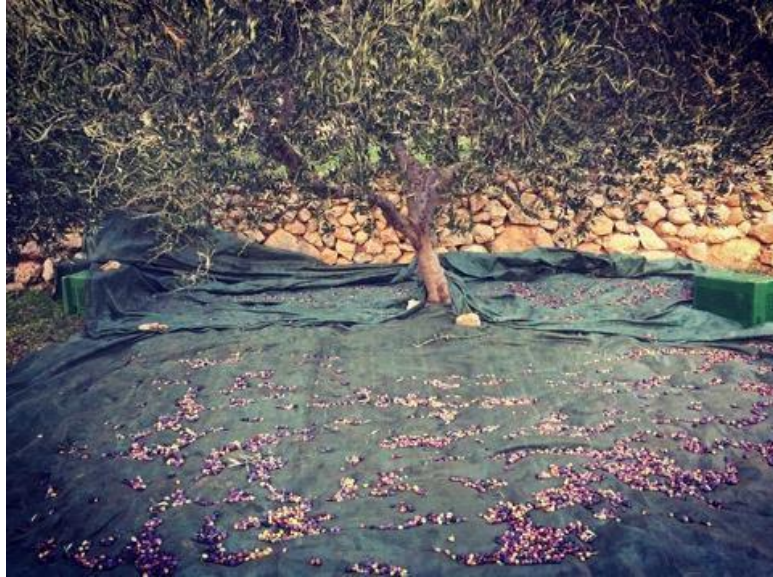
Slika 7. Tradicionalni način berbe na otoku Hvaru

utrošak energije i daje manje iskorištenje. Treći mogući način berbe je sakupljanje plodova sa tla. On se ne preporuča jer može doći do promjena u mesu ploda zbog višednevnog stajanja na tlu i upravo zbog toga je ulje slabije kvalitete (Škarica i sur.,1996).