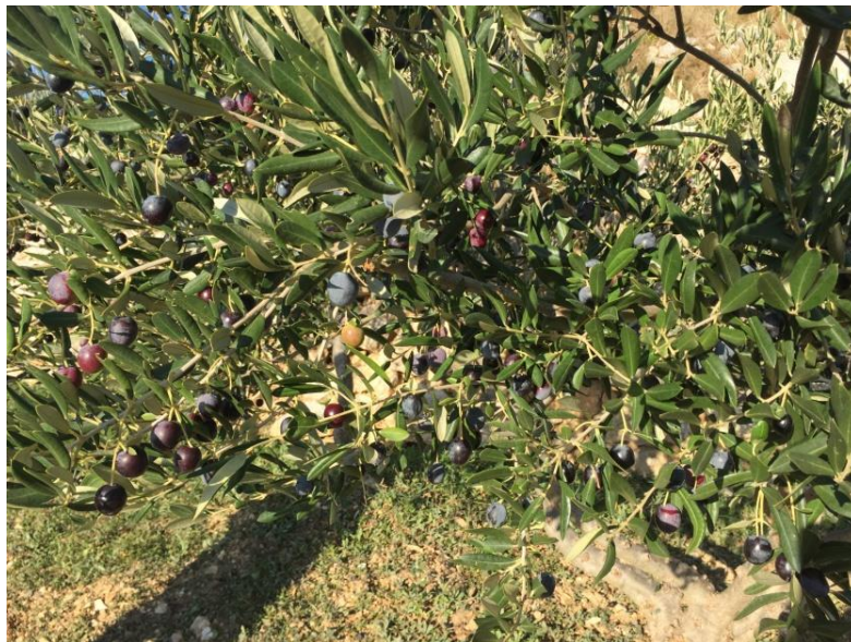
Slika 2. Plod masline sorte Oblica

Oblica je najzastupljenija i najstarija hrvatska sorta. Ime joj potječe od okruglastog, oblog oblika ploda (Škarica i sur., 1996). Raširena je od Pelješca pa sve do Krka. Na nekim područjima, kao što je otok Hvar, ona zauzima više od 98 % prostora u maslinicima. Sorta ima visoku toleranciju na sušu, niske temperature, bolesti i štetnike, te se može uzgajati na različitim položajima i nadmorskim visinama. Upravo je to razlog dobrog uspijevanja na našem području. S druge strane, karakteriziraju je neredovita rodnost i veliki postotak sterilnih cvjetova. Sadrži od 16 do 22 % ulja, a u prezrelom stanju od 24 pa naviše (slika 2).