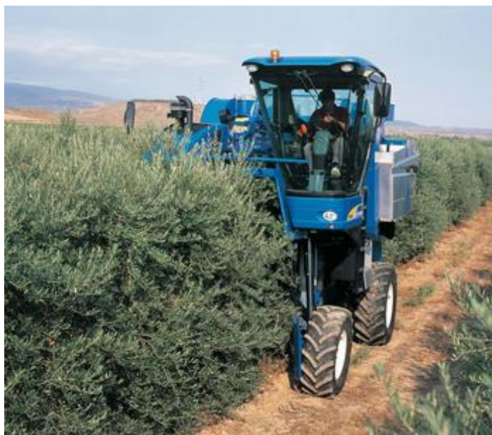
Slika 9. Mehanizirana berba maslina

Nakon berbe potrebno je masline transportirati u uljaru na preradu. Ako nije moguće isti dan preraditi masline, potrebno ih je na pravilan način uskladištiti kako bi se proizvelo ulje visoke kakvoće. Prostor u kojem se masline skladište mora biti zatvoren ili natkriven. Bitna je i temperatura skladišta, ne smije biti hladno jer štetno djeluje na plod masline, ni toplo jer pospješuje kvarenje. Optimalna temperatura skladištenja je oko 10 stupnjeva Celzijusa (Škarica i sur., 1996). Pravilan način je čuvanje plodova maslina na podu u tankom sloju najviše 10-15 cm i takve plodove potrebno je svaki dan promiješati da ne dođe do neželjenih reakcija. Ovakvim načinom plodovi se mogu uskladištiti maksimalno tjedan dana. Tradicionalnim načinom proizvodnje djevičanskog maslinovog ulja, plodovi maslina se čuvaju u slanoj vodi prije procesa prerade (slika 10). Takav način koristi se i danas, njime se smanjuje kvaliteta ulja te se gube bitne negliceridne komponente. U morsku vodu se dodaje ocat ili limunska kiselina radi sprečavanja pojave kvasaca i plijesni.