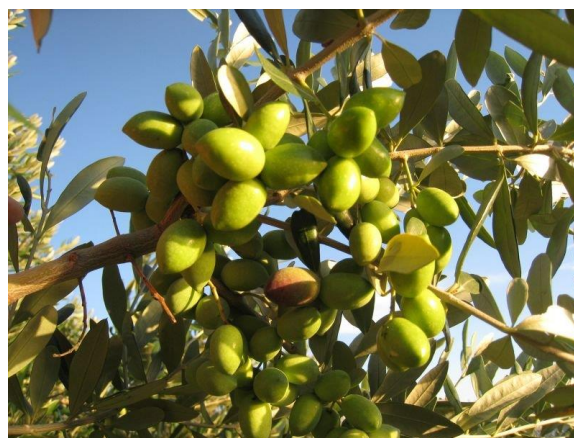
Slika 4. Plod masline sorte Levantinka ( http://paicusa.hr/hr/50/levantinka-najbolja-sorta-u-2011-godini )

Levantinka je uljna sorta podrijetlom sa otoka Šolte. Raširena je od Pelješca do Paga a karakterizira ju rodnost, redoviti i obilan prinos, sposobnost oprašivanja oblice i dužice. Slabo je otporna na sušu, a dobro otporna na jake vjetrove. Plod je srednje veličine, duguljast s malim vrškom (slika 4). Sadržaj ulja kreće se oko 20 %, a ulje je dobre kvalitete.