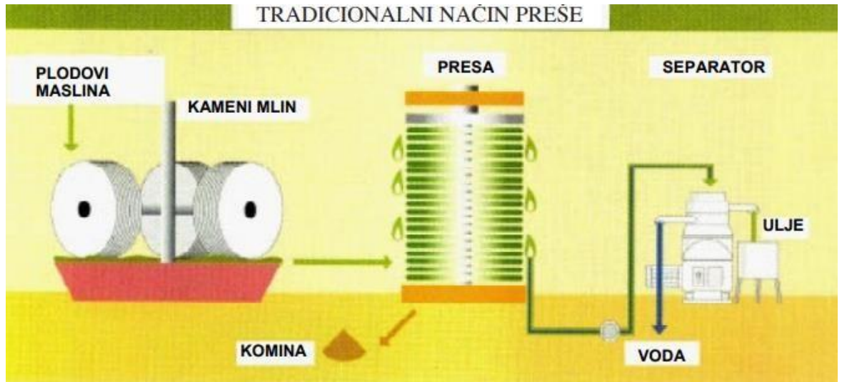
Slika 12. Shematski prikaz proizvodnje maslinova ulja tradicionalnim načinom preše (Gugić, 2006)

se postepeno prešanje , odnosno postepeno se povisuje tlak radi boljeg iskorištenja. Ulje dobiveno ovakvim postupkom sadrži velike količine vegetabilne vode, te se oni moraju odvojiti u centrifugalnom separatoru. Na slici 12 prikazana je tehnološka shema tradicionalnog načina proizvodnje djevičanskog maslinovog ulja.