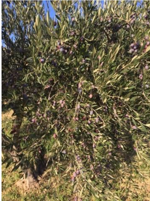
Slika 3. Plod masline sorte Lastovka

Levantinka je uljna sorta podrijetlom sa otoka Šolte. Raširena je od Pelješca do Paga a karakterizira ju rodnost, redoviti i obilan prinos, sposobnost oprašivanja oblice i dužice. Slabo je otporna na sušu, a dobro otporna na jake vjetrove. Plod je srednje veličine, duguljast s malim vrškom (slika 4). Sadržaj ulja kreće se oko 20 %, a ulje je dobre kvalitete.