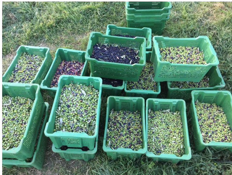
Slika 8. Plastične „gajbe“ za prijevoz ubranih plodova masline