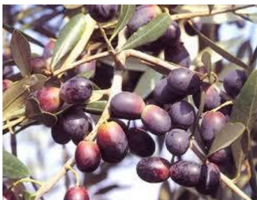
Slika 5. Plod masline sorte Leccino ( http://www.maslinovo.hr/procitaj/leccino-uljna-sorta/40/ )

Od stranih sorti na našem području nalazi se Leccino i Pendolino (Slika 5 i 6). Talijanske uljne sorte iz Toskane. Leccino je otporna na niske temperature i bolesti masline. Sadrži od 16 do 18 % ulja. S druge strane, Pendolino služi kao oprašivač za Leccino i Frantoio. Ima sitne podove težine do 2,5 g a sadržaj ulja oko 22 % ( Elezović, 1964).