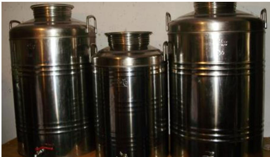
Slika 14. Spremnici od nehrđajućeg čelika za čuvanje ulja

povećanja temperature dovodi do ubrzavanja oksidacijskih reakcija te kvarenja ulja. S druge strane, preniske temperature (oko 4 stupnja) uzrokuje smrzavanje ulja pri čemu dolazi do gubitka aromatskih sastojaka. Ulje ima svojstvo da lako upija hlapive i mirisne komponente, zato je bitno da prostor bude oslobođen svih stranih mirisa. Danas se ulje najčešće skladišti u spremnicima izgrađenim od nehrđajućeg čelika odnosno INOX-a (slika 14). Takav materijal je fizički i kemijski inertan prema maslinovom ulju te je očuvana njegova kvaliteta i zdravstvena ispravnost (Škarica i sur.,1996).