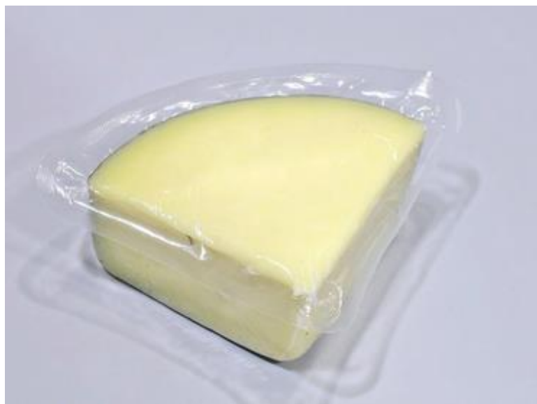
Slika 1: Sir zapakiran u ambalažu od polipropilena s imobiliziranim natamicinom ( http://www.natamycinvgp.com/study-of-the-development-of-antimicrobial-active-packaging-and-natamycin/#prettyPhoto )

Natamicin je fungicid koji nastaje tijekom aerobne fermentacije Streptomyces natalensis . U sirarstvu se primjenjuje u svrhu sprječavanja rasta nepoželjnih plijesni i kvasaca. Nanosi se na površinu tvrdih, polutvrdih i polumekih sireva. Kvasci su manje otporni na djelovanje natamicina od plijesni, pa već koncentracije manje od 5 ppm-a mogu inhibirati njihov rast, dok je za plijesni potrebna koncentracija viša od 10 ppm-a (Jalilzadeh i sur., 2015).