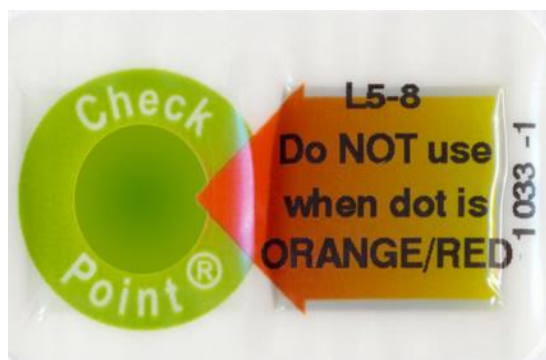
Slika 2: Primjer CheckPoint® TTI indikatora tvrtke Vitsab. Zelena oznaka pocrveni kad je proizvod izložen uvjetima temperature koji narušavaju njegovu sigurnost (Bieganska, 2017)

TTI indikatori mogu se koristiti u proizvodnji sira za praćenje pasterizacije mlijeka za proizvodnju sira te za praćenje temperature tijekom zrenja i skladištenja sira. Pri tom je potrebno temperaturu prilagoditi vrsti sira kako bi se maksimalno očuvala njegova kvaliteta (Patel i sur., 2015).