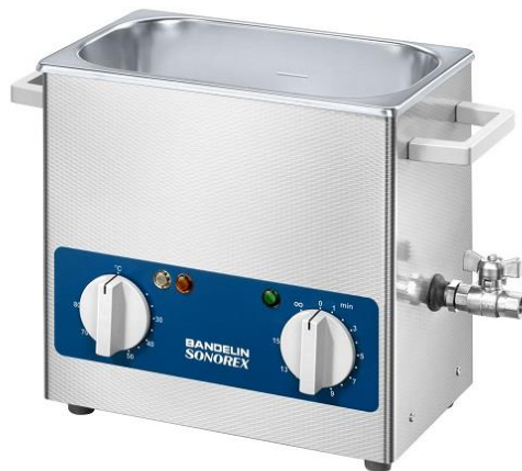
Slika 4. Ultrazvučna kupelj tvrtke Bandelin (Anonymous 3)