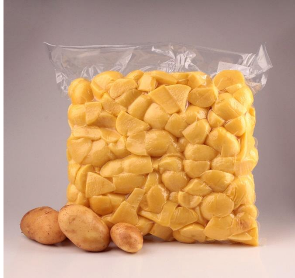
Slika 2. Minimalno procesirani krumpir (Anonymous 2, 2012)

Kod proizvodnje minimalno procesiranog krumpira (Slika 2.) potrebno je voditi računa o nizu faktora koji direktno utječu na kvalitetu, stabilnost, a naposljetku i prihvatljivost od strane potrošača. Neki od navedenih faktora su odabir kultivara, primjena adekvatnih fizikalnih ili kemijskih metoda za sprečavanje posmeđivanja, način i vrijeme skladištenja, vrsta pakiranja i tretman alternativnim netoplinskim metodama.