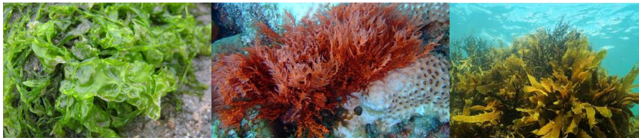
Zelene alge - Chlorophyceae

Makrobentoske alge se svrstavaju u tri skupine: zelene alge ( Chlorophyceae ), smeđe alge ( Phaeophyceae ) i crvene alge ( Rhodophyceae ) (Kadam i sur., 2013). Fotosintetski pigmenti koji određuju boju algi imaju važnu ulogu u klasifikaciji istih (Van Den Hoek i sur., 1995). U tropskim područjima dominiraju crvene i zelene morske alge, dok su smeđe zastupljenije u hladnijim regijama.