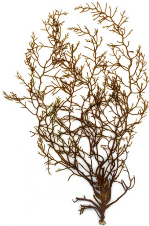
Slika 2. Smeđa alga Cystoseira sp. (prema Anonymous 4, 2018)