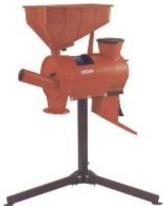
Slika 3. Mlinovi čekićari (Anonymous 3)