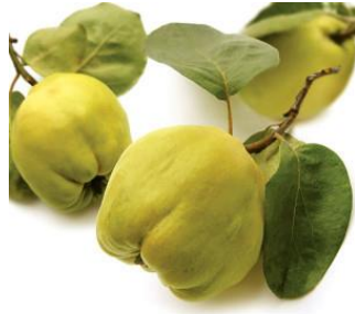
Slika 2. Leskovačka dunja (Anonymous 2)