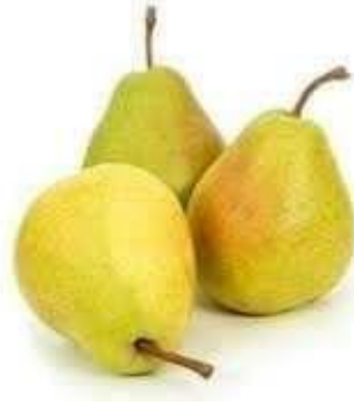
Slika 1. Kruška viljamovka (Anonymous 1)