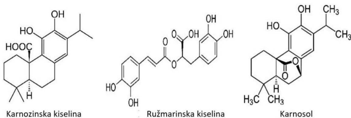
Slika 1. Strukturne formule najzastupljenijih fenolnih spojeva ružmarina (Xie i sur., 2017)

Zbog svojih se ljekovitih učinaka ekstrakti ružmarina naširoko koriste u farmaceutskoj industriji, ali sve se više koriste i u prehrambenoj industriji zbog svog antioksidativnog djelovanja.