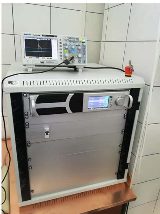
Slika 4. Uređaj za visokonaponsko pražnjenje (Anonymous, 2017)

U tablicama 1 i 2 prikazani su uvjeti pod kojima su bili tretirani usitnjeni uzorci origana.