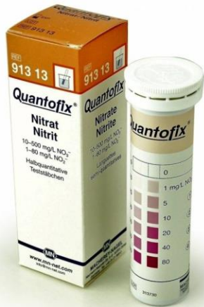
Slika 5. Indikator trakice za određivanje slobodnih radikala