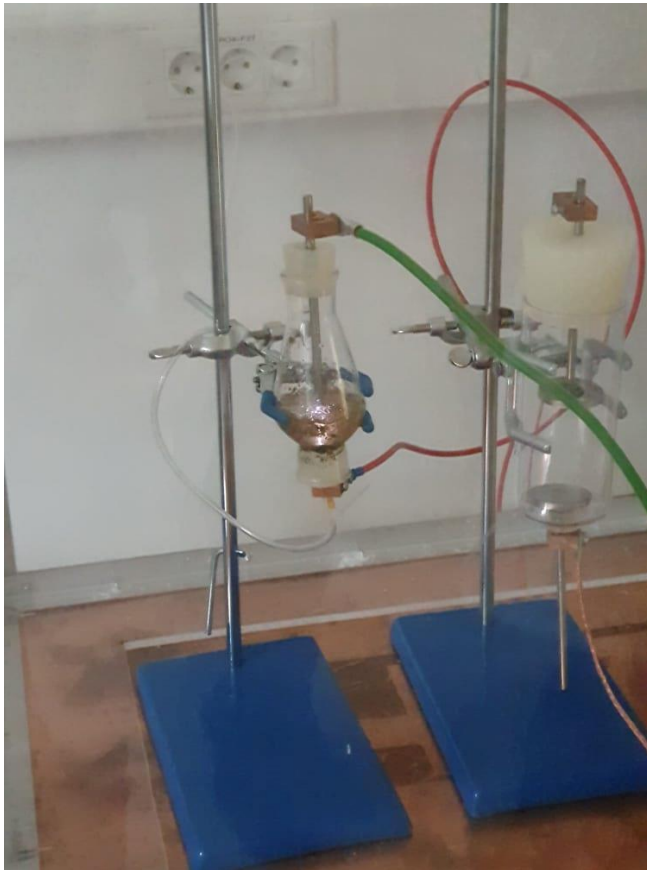
Slika 3. Ekstrakcija u generator

odnosno 9 minuta pri odgovarajućim uvjetima napona (Tablica 1.). Dobiveni ekstrakti profiltriraju se preko filter papira.