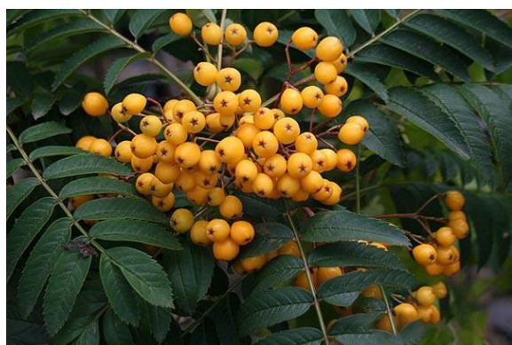
Slika 3. Žarko žuti plodovi sorte 'Sunshine' (Anonymous 1, 2021)

Sorbus aucuparia 'Fastigiata' (slika 4) ukrasna je sorta koja raste u visinu od 7 do 8 m većinom na pjeskovitom tlu, no može rasti i na drugim tlima, dok god nemaju previše vlage. Daje tamnocrvene plodove (Drvodelić i sur., 2019).