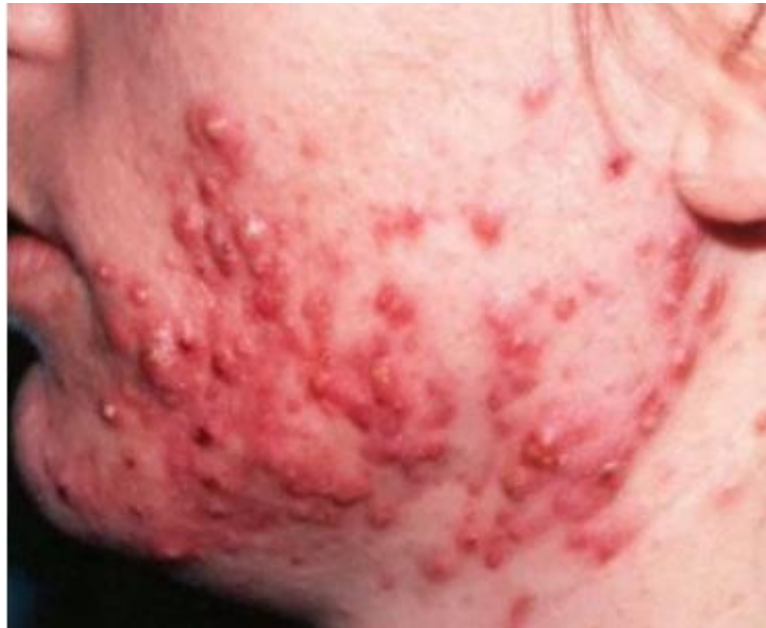
Slika 3. Nodularne/konglobatne akne (Anonymous 3,2021)