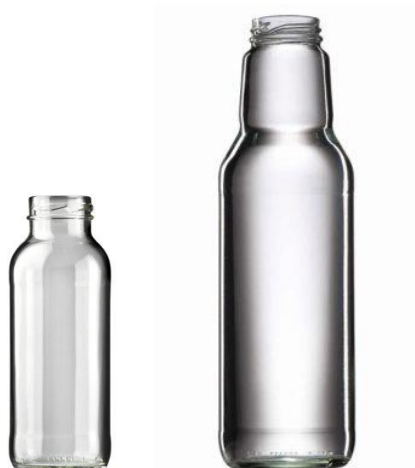
Slika 9. Staklene boce 250 mL i 750 mL (Vetropack, 2021)

Nakon berbe bobičastog voća, kreće proizvodnja funkcionalnog soka aronije, borovnice i crnog ribiza (tablica 6) vrlo atraktivne tamne boje i visoke nutritivne vrijednosti. Sok bi se pakirao u staklene boce od 250 mL te 750 mL (slika 9). Sastavni dio ambalaže su zatvarači, odnosno twist-off poklopci. Napunjene boce se pakiraju u kartonske kutije koje se skladište na paletama u prostorijama za skladištenje gotovog proizvoda.