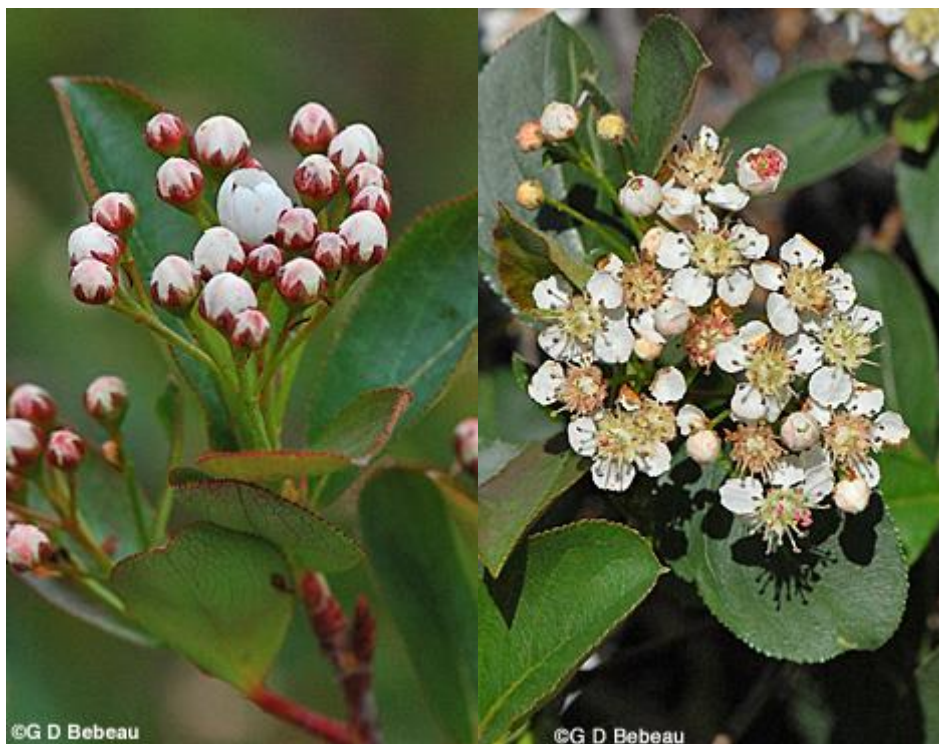
Slika 3. Cvijet biljke Aronia melanocarpa (Anonymous 1, 2021)

Aronija je bogata širokim spektrom biološki aktivnih spojeva poput antocijana, flavonoida, vitamina, minerala koji povoljno utječu na zdravlje. Ustanovljeno je da ekstrakt aronije posjeduje antivirusna i antibakterijska svojstva, a može sudjelovati u zaštiti gastrointestinalnog sustava (Platonova i sur., 2021).