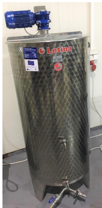
Slika 15. Spremnik soka (Euclid, 2021)

Dimenzije (promjer x visina) (mm): 640 x 1515