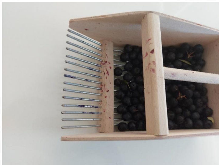
Slika 11. Drveni alat za branje bobičastog voća

Berba crnog ribiza odvija se ručno kada je 90 % bobica posve zrelo. Crni ribiz bere se ručno, u obliku cijelih grozdova, te stavlja u kašete u kojima će se otpremiti do pogona (Volčević, 2005).