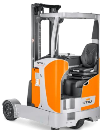
Slika 19. Viličar (Still viličari, 2021)