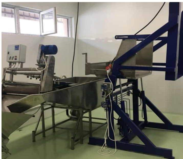
Slika 13. Uređaj za istresanje iz boks palete IP 1000 (Euclid, 2021)