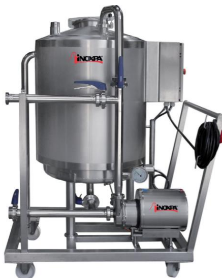
Slika 20. Ručno pokretni mobilni sustav za pranje uređaja i opreme (Inokspa, 2021)