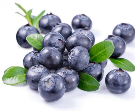
Slika 4. Plod biljke borovnice, Vaccinium myrtillus (Anonymous 2, 2021)

Borovnica ( Vaccinium myrtillus ) dvogodišnja je biljka koja uspijeva na području sjeverne Amerike, ali i u šumama i šumskim livadama Europe. Razgranata, zelena stabljika može narasti na visinu od 1 do 1,5 m. Listovi su ovalni, jarko zelene boje, dok su cvjetovi crvenkasti ili zelenkasto-ružičasti i okrugli. Sezona cvjetanja borovnice je od travanja do lipnja (De Smet, 1993). Borovnica ima male bobice (slika 4), promjera 5 do 9 mm, plavkaste boje s mnogo sjemenki (Chu i sur., 2011).