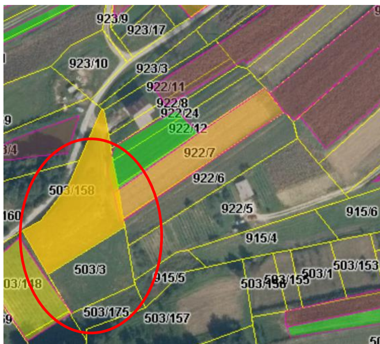
Slika 7. Mikrolokacija pogona za proizvodnju soka iz bobičastog voća (Katastar, 2019)

Izgradnja pogona predviđena je na 3 susjedne parcele ukupne površine 2902 m 2 (k.č. 503/158, 503/3, 503/175). Čestica 503/158 ima direktan cestovni pristup, pri čemu je omogućen nesmetan transport repromaterijala i gotovog proizvoda (slika 7) (Katastar, 2019). Veličina zemljišta u skladu je s procijenjenom površinom za izgradnju pogona, parkirališta i vanjskog prostora potrebnog za prihvata sirovine kao i distribuciju gotovih proizvoda.