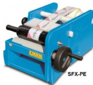
Slika 18. Etiketirka za okrugle boce SFX-PE ( Pakiranje.net, 2016)