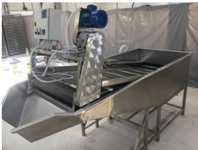
Slika 14. Uređaj za pranje voća UP 1000 (Euclid, 2021)