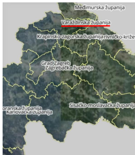
Slika 6. Varaždinska županija (Katastar, 2019)

Za makrolokaciju pogona za proizvodnju soka iz bobičastog voća aronije, borovnice i crnog ribiza odabrana je Varaždinska županija (slika 6), područje grada Ivanca. Odabir ove lokacije temeljio se na dobrom geografskom položaju, u jednoj od gospodarski najprosperitetnijih županija Hrvatske. Dobra prometna povezanost s okolnim gradovima olakšava dopremu sirovine u pogon. Rastući razvoj infrastrukture omogućava dostupnost energenata, vode, radne snage kao i odvodnju otpadnih voda. Također, lokacija pogona se ne nalazi u blizini kemijske industrije za potencijalno štetan utjecaj na proizvodnju. Izgradnja ovakvog industrijskog pogona doprinijela bi razvoju gospodarstva na području grada Ivanca te također potaknula lokalno stanovništvo na uzgoj bobičastog voća, aronije, borovnice ili crnog ribiza. Dostupni podaci o gradu Ivanču daju uvid o tome da nema registriranog pogona za proizvodnju soka. Stoga, na temelju sakupljenih informacija zaključilo se kako bi izgradnja ovakvog pogona imala višestruki pozitivan utjecaj na razvoj ovog područja čime bi se potaknulo lokalno stanovništvo na uzgoj bobičastog voća, ali i otvorila nova radna mjesta (Poslovna zona Ivanec, 2021).