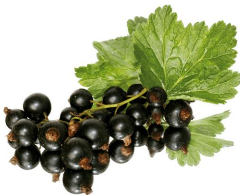
Slika 5. Plod biljke crnog ribiza ( Ribes nigrum ) (Anonymous 3, 2021)

Crni ribiz ( Ribes nigrum ) uzgaja se uglavnom zbog plodova koji se prerađuju u sokove ili džemove (slika 5). Raste u obliku grma od 1-2 m visine. Prirodno raste na području istočne i središnje Europe, te Azije. Uspijeva i u krajevima s oštrom klimom, a odgovara mu i polusjenovito mjesto. Dozrijeva u lipnju (Grlić, 1990). Zrela bobica crnog ribiza je slatka, aromatična, sjajna te tamo ljubičaste boje promjera do 12 mm (Gopalan i sur., 2012).