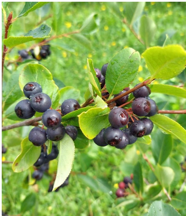
Slika 2. Plod biljke aronije Aronia melanocarpa

U prirodi, aronija je listopadni grm koji može narasti 2 do 3 m visine i 2,5 m širine. U klimatskim uvjetima kontinentalne Hrvatske cvate krajem travnja u obliku velikih bijelih cvjetova (slika 3). Listovi su ovalni, tamnozeleno boje, dok u jesen poprimaju dekorativnu žarko crvenu boju. Cvjetove oprašuju kukci, dok se dio oprašuje vjetrom. Okrugli tamni plodovi dozrijevaju krajem kolovoza. Bobice karakterizira slatka do kiselkasta i trpkava aroma (Milić M., 2012). Upravo zbog svog karakterističnog oporog okusa, plodovi aronije se često prerađuju u različite proizvode kao što su sokovi, džemovi i vina (Tomić i sur., 2016). Može se očekivati prinos od 5 do 12 tona po hektaru za otprilike 5 godina, nakon što biljka sazrije (Kulling i Rawel, 2008).