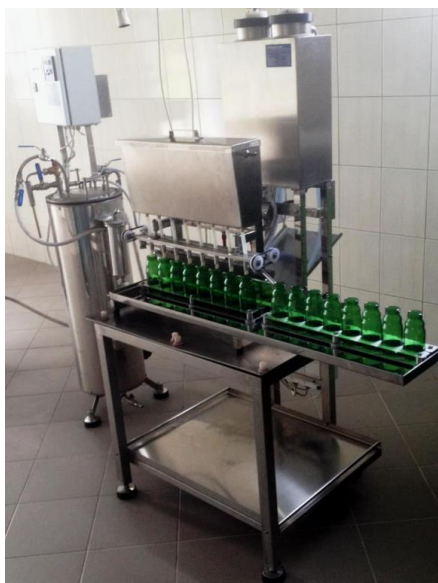
Slika 16. Punilica soka u boce (Euclid, 2021)