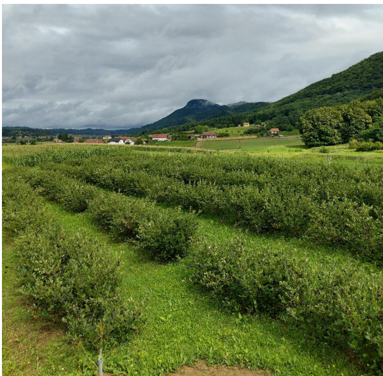
Slika 8. Nasadi aronije, čestica 922/24, Varaždinska županija