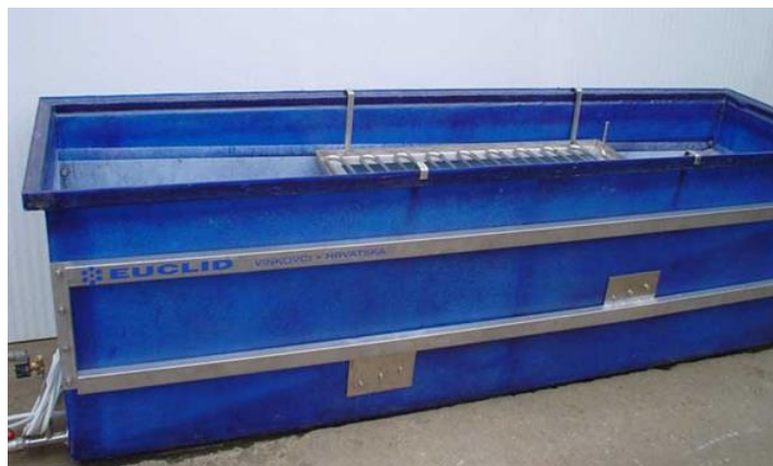
Slika 17. Hladnjak boca (Euclid, 2021)

Dimenzije (duljina x visina x širina) (mm): 2500 x 800 x 600