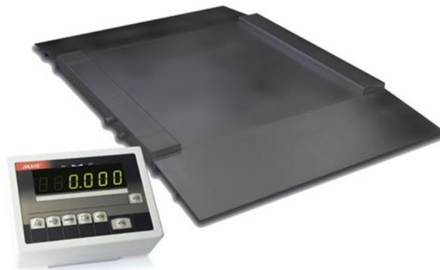
Slika 12. Podna vaga s navozom (Probus, 2020)