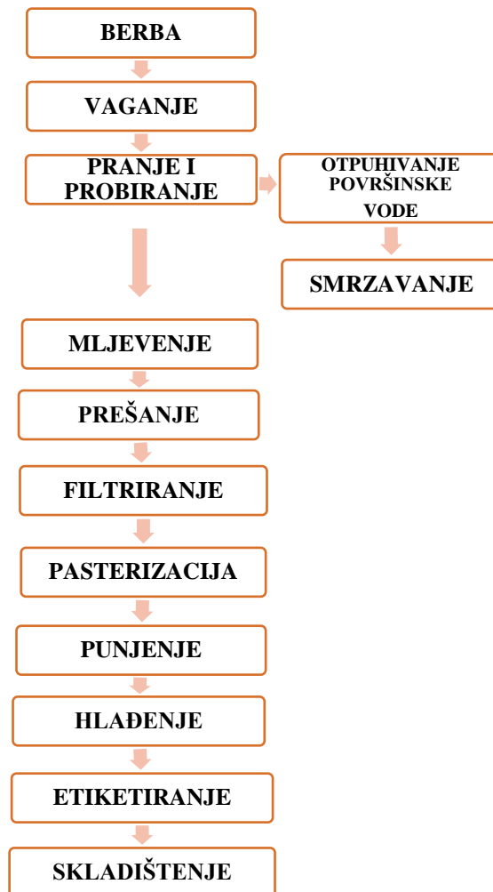
Slika 10. Shema proizvodnje soka iz bobičastog voća u planiranom objektu (vlastita shema)