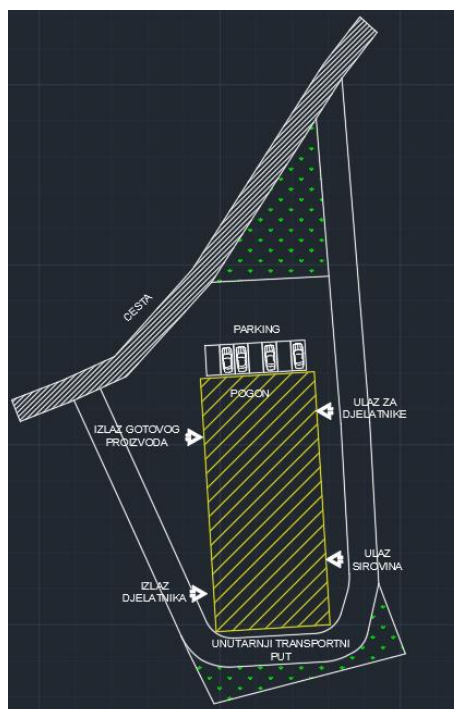
Slika 22. Situacijski plan (vlastita slika)

Situacijski plan (slika 22 i prilog 2) izrađen u AutoCAD-u prikazuje planirani pogon za preradu bobičastog voća površine 869 m 2 smješten na tri susjedne čestice ukupne površine 2902 m 2 s direktnim pristupom na cestu.