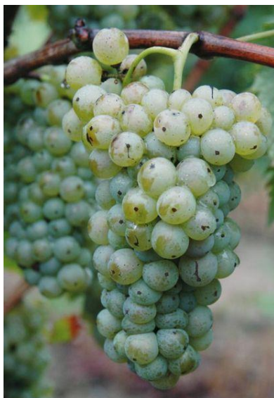
Slika 1. Grozd sorte Graševina bijela

Graševina je u vinogradarskom sortimentu Republike Hrvatske (RH) zacijelo najzastupljenija vinska sorta bijeloga grožđa (Slika 1). Pravilnikom o vinu (NN 159/04.) uvrštena je među preporučene kultivare u svim podregijama regije Kontinentalna Hrvatska, zbog toga što kontinentalna Hrvatska ima klimu sličnu Francuskoj iz koje sorta potječe.