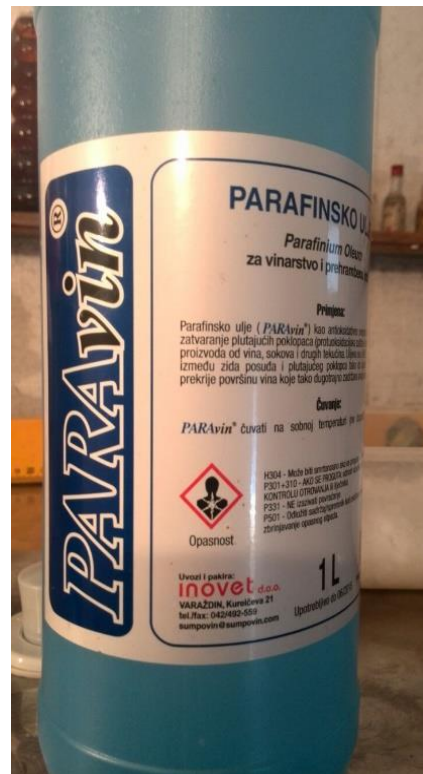
Slika 10. Parafinsko ulje