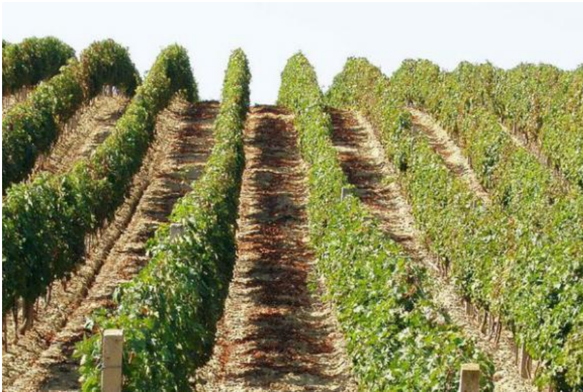
Slika 3. Iločko vinogorje

koje ovaj kraj ima za uzgoj vinove loze, te uveo nove, kvalitetnije sorte podrijetlom iz Grčke. Nakon oslobođenja od Turaka, kneževska obitelj Odescalchi obnovom dvorca nadograđuje, proširuje i modernizira podrumarstvo i vinogradarstvo te sam vinski podrum koji je prvotno građen u 15.st. Ovi napredni talijanski plemići u 17.st. donose u Ilok između ostalog i sorte Traminac te Zeleni silvanac i podižu nove nasade. Danas je iločki Traminac prema rječima struke ponajbolji u Hrvatskoj i šire, čemu u prilog govori činjenica da je poslužen na svečanosti krunidbe engleske kraljice Elizabete II., a i prije toga je bio uvršten među vina koja se poslužuju na engleskom kraljevskom dvoru. Pored Traminca tu su i Graševina, Rajnski rizling, Chardonnay, Pinot, Frankovka, Cabernet sauvignon, Merlot i brojne druge sorte. U drugoj polovici 20. stoljeća vinogradarstvo, voćarstvo i vinarstvo većim dijelom su bili predmet aktivnosti zadruga, kada se podižu prvi i najveći plantažni nasadi vinograda na prostorima bivše države. Nakon povratka Iločana iz progonstva 1998 g., obnovom, privatizacijom i društvenom reorganizacijom sve je veći broj manjih, privatnih vinogradara i vinara. Podignuto je oko 600 hektara novih nasada, te je sada pod vinogradima oko 1700 hektara zemlje koja trenutno broji oko 300 vinogradara i 17 vinarija (Anonimus 5).