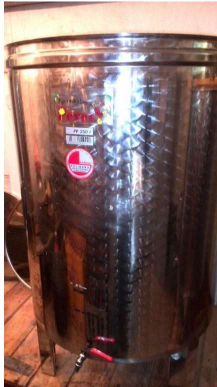
Slika 6. Vinifikator

podnošenje različitih ekstremnih uvjeta okoline, prisutnih u industrijskim pogonima, dovelo je do selekcije nekoliko stotina sojeva ovog kvasca s poznatim karakteristikama (Grba, 2010.). Nakon završene fermentacije kvasci vrste S. cerevisiae brzo izumiru, tako da se rijetko susreću u vinu i nemaju velikog značaja za pojavu naknadne fermentacije (Radovanović, 1986.).