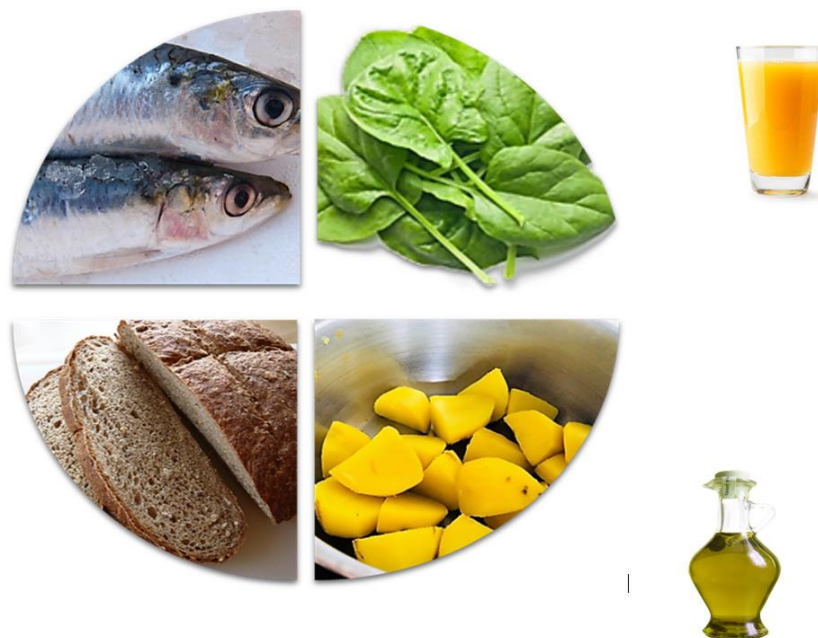
Slika 2. Konceptualni model tanjura za ručak ili večeru rađen prema principima mediteranske dijeta (Vranešić Bender, 2005)

istraživanje pokazalo da su ispitanici s ADHD-om češće jeli u restoranima brze hrane i preskakali doručak u odnosu na kontrolnu grupu. To je rezultiralo povećanim unosom dodanih šećera i kofeina u obliku zaslađenih napitaka i slatkiša, a nedovoljnim unosom proteina. Prema nekim istraživanjima, takva prehrana može rezultirati značajnim oštećenjem sposobnosti održavanja pažnje i pamćenja te bihevioralnim problemima kod djece. Iz navedenih podataka može se zaključiti da postoji veza između prehrane niske kvalitete i povećanog rizika za pojavu ADHD-a kod djece. Iako se određeni nutrijenti navode kao problematični pa se preporučuje redukcija njihovog unosa, pristup koji obuhvaća modifikaciju kompletne ishrane mogao bi rezultirati puno povoljnijim učincima na zdravstveno stanje djeteta. Ríos-Hernández i sur. (2017) navode kako je mediteranska dijeta primjer je dobro izbalansiranog prehrambenog obrasca koji omogućuje zadovoljavanje preporučenog unosa većine esencijalnih nutrijenata. Stoga svakako treba razmotriti njezino uvođenje kao dijetoterapijskog pristupa kod dijagnoze ADHD-a i podrobnije istražiti sve benefite koje može pružiti takva ishrana (Ríos-Hernández i sur., 2017).