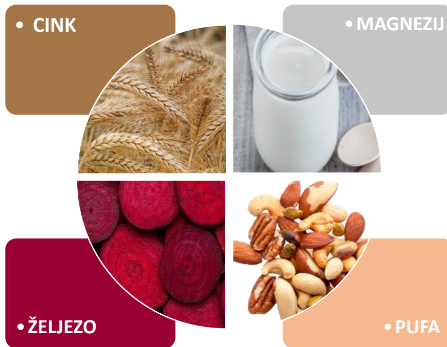
Slika 4. Prikaz dobrih izvora esencijalnih mikronutrijenata koji se povezuju s ADHD-om konceptualnim modelom (Lange i sur., 2017)