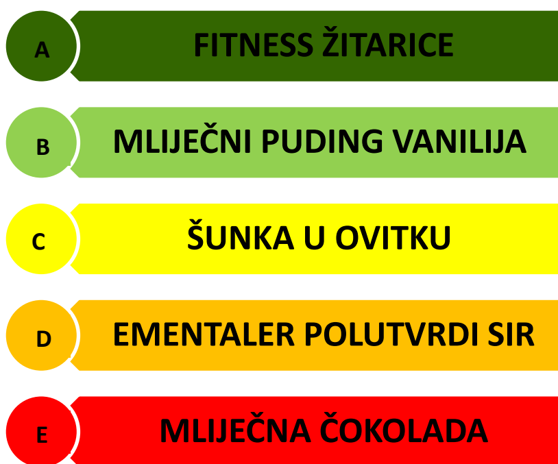
Slika 1. Klasifikacija hrane i pića prema nutritivnoj vrijednosti pomoću „Nutri-score“ semafora kao konceptualnog modela (Health, Food Chain Safety and Environment, 2020)

izgleda kao ljestvica koja rangira prehrambene proizvode od zdravijih prema manje zdravim izborima. Ljestvica počinje slovom „A“ (prehrambeni proizvodi vrlo kvalitetnog nutritivnog sastava), a završava slovom „E“ (prehrambeni proizvodi niskokvalitetnog nutritivnog sastava). Primjer namirnice kvalitetnog nutritivnog sastava s oznakom „A“ su integralne žitarice, a primjer namirnice siromašnog nutritivnog profila s oznakom „E“ je čokolada (tablica 1). Dakle, konceptualni modeli predstavljaju pojednostavljene grafičke prikaze kojima se želi vizualizirati određena ideja ili problematika po načelima logičkog razmišljanja. Iako za sada još uvijek nije definiran prehrambeni obrazac koji bi trebala slijediti djeca s dijagnozom ADHD-a, znanstvenici svakako stavljaju naglasak na prednosti konzumacije uravnotežene prehrane, uz restrikciju unosa određenih nutrijenata poput šećera ili zasićenih masnih kiselina, s ciljem ublažavanja prisutnih simptoma.