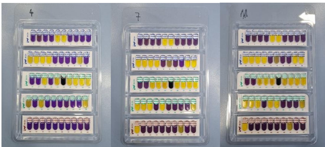
Slika 2. API biokemijski profili ispitivanih bakterijskih izolata (vlastita fotografija)

Ispitivana bakterijska kultura uzgojena je na MRS agaru u obliku kolonija anaerobno kroz 24 sata pri 37 °C. Pomoću mikrobiološke ušice se u kivetu koja sadrži API 50 CHL medij, dodalo nekoliko identičnih kolonija s MRS agara. Gustoća inokuluma mjerena je u denzimatu, a mora biti 2 McF. Pripremljena suspenzija se nakapala u jažice API 50 CH V5.1 stripa koji sadrži 49 različitih ugljikohidrata. U sve jažice nakapalo se i mineralno ulje kako bi se osigurali anaerobni uvjeti, te je provedena inkubacija pri 37 °C kroz 48 sati, nakon čega su očitani rezultati. Pozitivni testovi su oni kod kojih je došlo do promjene boje u žuto, uslijed acidifikacije i prisutnosti bromkrezol purpurnog indikatora (slika 2). Biokemijski profil je identificiran pomoću programa na računalu koji sadrži bazu podataka (V 5.1). Razina pouzdanosti izražena je kao izvrsna ( \geq 99.9\% ), veoma dobra ( \geq 99.0\% ), dobra ( \geq 90.0\% ), prihvatljiva ( \geq 80\% ) ili neprihvatljiva identifikacija ( < 80\% ).