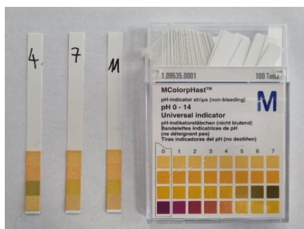
Slika 4. Izmjerene pH vrijednosti hranjive podloge nakon prekonoćnog rasta bakterijskih izolata

Još jedna od glavnih karakteristika BMK je da su katalaza negativne tj. nemaju sposobnost sinteze enzima peroksidaze (Bratulić i sur., 2019; von Wright i Axelsson, 2019). Dodatkom vodikovog peroksida nije došlo do pojave pjenjenja nit kod jednog izolata pa se može zaključiti da su sva tri katalaza negativni. Ono što je još karakteristično za BMK je da tijekom rasta u hranjivoj podlozi, uslijed proizvodnje mliječne kiseline dolazi do smanjenja pH vrijednosti pa je u sljedećem koraku pokusa provjerena pH vrijednost primjenom indikator trakica (slika 4).