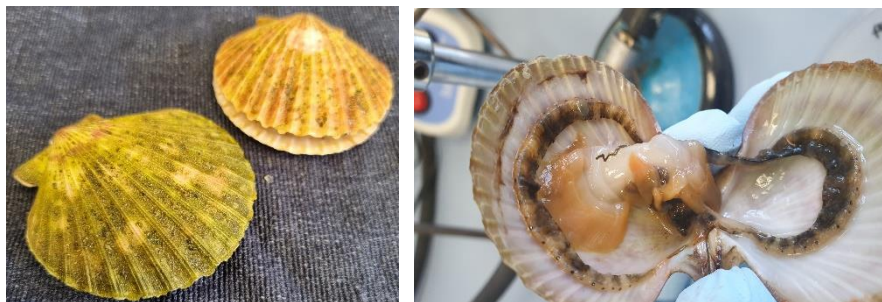
Slika 1. Svježe izlovljene češljače

U ovom radu korištena je vrsta školjkaša češljača ( Aequipecten opercularis ) (slika x). Školjkaši su izlovljeni u Istarskom akvatoriju (44°43'58.49"N, 13°56'48.94"E) s dubine od 49 m i u odgovarajućim uvjetima skladištenja pri niskim temperaturama poslani su u laboratorij za opću mikrobiologiju i mikrobiologiju namirnica na Prehrambeno-biotehnološki fakultet Sveučilišta u Zagrebu. Prikupljanje i analiza školjkaša je dio projekta financiranog iz EU fondova naslova "Integrirani sustav uzgoja alternativnih vrsta školjkaša u uvjetima klimatskih promjena". Iz uzoraka probavnog sustava prethodno su izolirane potencijalne kolonije bakterija mliječne kiseline na MRS agaru koje će se identificirati u sklopu ovog završnog rada.