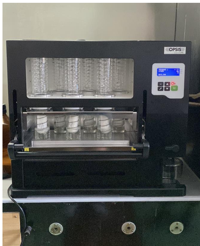
Slika 5. SOXROC aparatura za ekstrakciju ulja