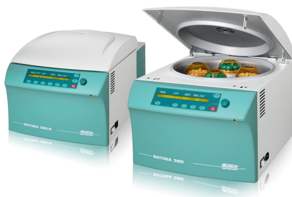
Slika 7. Centrifuga (Hettich Rotina, 2023)

Tuttlingen, Njemačka) centrifugi. Velike kivete napunjene maslinovim tijestom centrifugirane su 5 minuta na 5000 okretaja nakon čega je tekući dio (ulje i vegetabilna voda) odvojen u laboratorijsku čašu od 400 ml. U drugoj fazi centrifugiranja falkonice od 50 ml su napunjene s tekućim dijelom i centrifugirane 5 minuta na 5000 okretaja. Vegetabilna voda ostala je u donjem sloju dok se ulje prelijeva iz gornjeg sloja. Ulje je skladišteno u tamnim staklenim bocama od 250 ml.