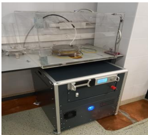
Slika 5. Obrada maslinovog tijesta PEP uređajem