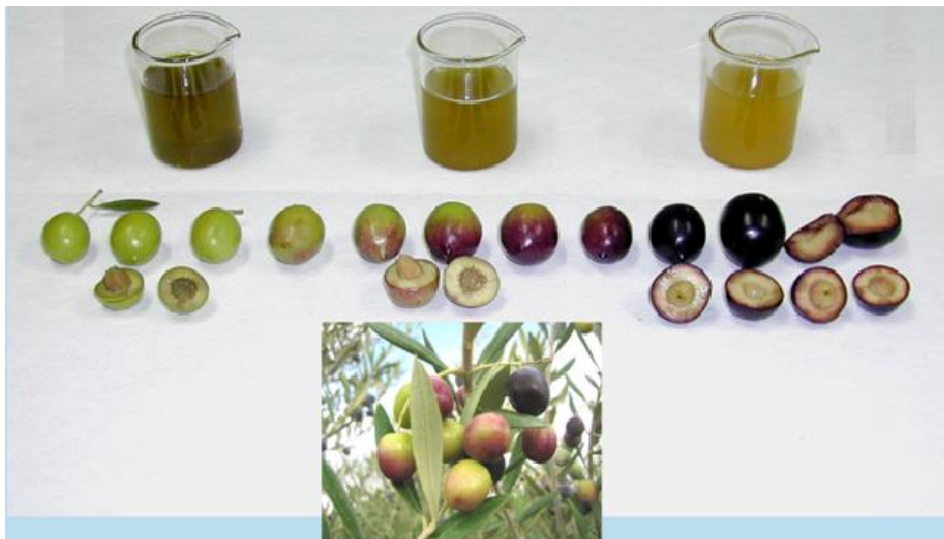
Slika 8. Kategorije na osnovu boje pokožice i pulpe (IOC, 2011)

Indeks zrelosti dobije se primjenom sljedeće formule, gdje A, B, C, D, E, F, G i H predstavljaju broj plodova u svakoj od kategorija (0, 1, 2, 3, 4, 5, 6, 7) :