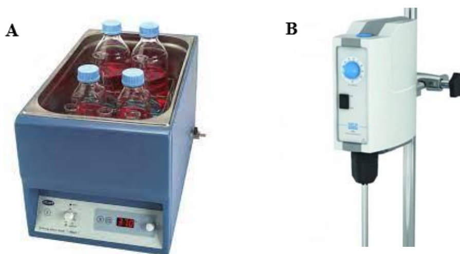
Slika 6. Vodena kupelj (Cole-Parmer, 2019) (A) i miješalica (Velp Scientifica, 2023) (B)

Sljedeća faza proizvodnje je miješenje koje se odvijalo u Stuart SBS80 (Cole-Parmer, Vernon Hills, IL, SAD) vodenoj kupelji napunjenoj sa 35 L destilirane vode uz dodatak obične vode kako bi se spriječilo hrđanje kupelji. Kupelj je zagrijana na 30,5 °C te su u nju stavljene posude za miješenje sa dvostrukim plaštom čija je stijenka također napunjena vodom. U posudu za miješenje stavljeno je 2 kg tijesta maslina nakon PEF tretmana, ili bez tretmana u slučaju kontrolnog uzorka. Miješalica koja je korištena je Velp Scientifica (Usmate, Italija) postavljena na 2,5 okretaja. Miješenje je trajalo 40 minuta nakon čega je miješalica isključena, posuda za miješenje uklonjena iz kupelji i sadržaj posude prebačen u posudice za centrifugiranje. Za vrijeme miješenja povremeno je kontrolirana temperatura tijesta koja je 20 do 25 minuta nakon postavljanja na kupelj trebala iznositi 27 °C.