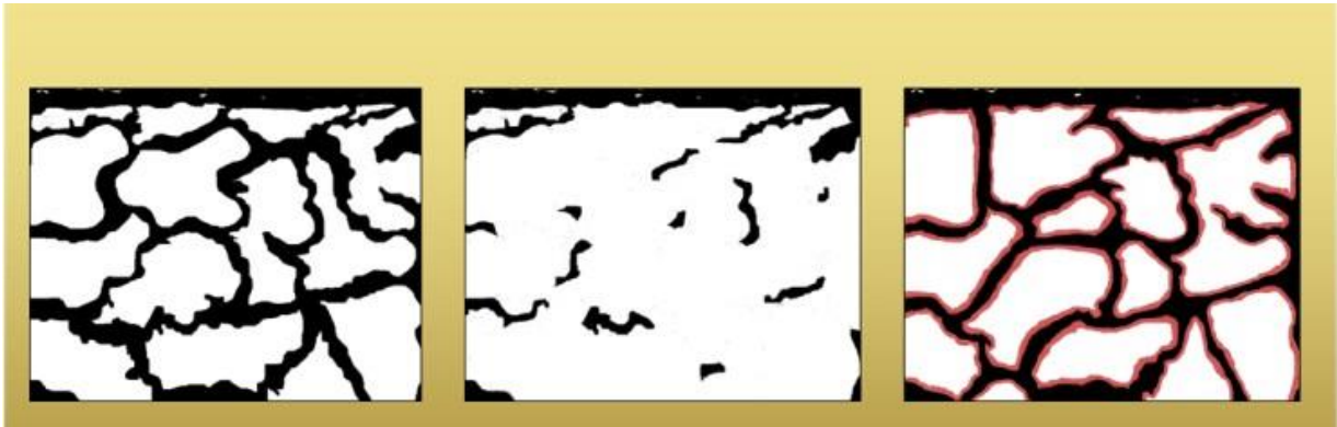
Slika 2. Prikaz strukture kostiju s lijeva na desno: normalna struktura kostiju, osteoporozna i osteomalacija (Charoenngam i sur., 2019)

Najviše prijeloma kostiju izazvano je padovima koji su povezani sa slabošću mišića. Mišići povezani s kostima zahtijevaju vitamin D za normalno funkcioniranje. Nedostatak vitamina D ispod razine 16 ng/mL oslabljuje funkciju mišića (Charoenngam i sur., 2019). Istraživanja koja su provedena in vitro su pokazala kako vitamin D može povećati sintezu proteina i stanični rast u stanicama mišića tako da poveća veličinu i broj mišićnih vlakana koja se prva regrutiraju pri padu. Studija koju su proveli Bischoff-Ferrari i sur. (2004) dokazala je da su koncentracije vitamina D u krvi u intervalu od 40 do 90 nmol/L poboljšale mišićnu funkciju u odnosu na mišićnu funkciju kada je koncentracija vitamina D u krvi bila manja od 40 nmol/L. Također, ta je studija dokazala i kako bi i prije samog prepoznavanja celijakije kod ispitanika s nedostatkom vitamina D mogla biti vidljiva oslabljena mišićna funkcija. To sve ukazuje na to kako nakon nadoknade vitamina D kod bolesnika s celijakijom dolazi do poboljšanja koštane i mišićne funkcije. Međutim, postoje i studije koje ukazuju na to kako kod bolesnika s celijakijom na poboljšanje zdravlja kostiju i mišića može utjecati i dijeta bez glutena.