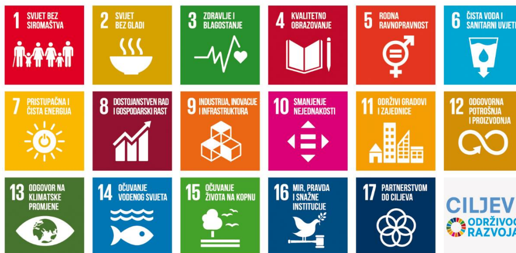
Slika 1. Ciljevi održivog razvoja (UN, 2021)