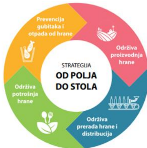
Slika 3. Od polja do stola (Ministarstvo poljoprivrede, 2021)