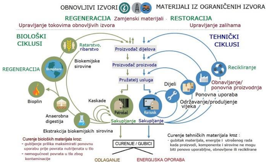
Slika 6. Kružno gospodarstvo (Center for Business and Environment, 2015)