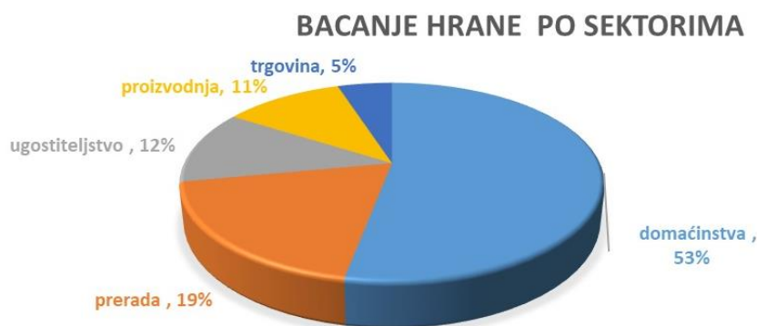
Slika 5. Proizvođači otpada po sektorima EU (FUSIONS, 2016)