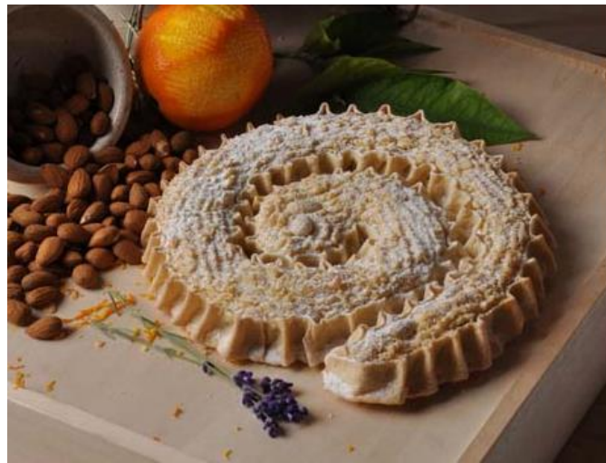
Slika 4. Prikaz tradicionalne hrvatske slastice „Rapska torta“ (23)

Autentična slastica nosi oznaku „otočni proizvod“. Projekt „Hrvatski otočni proizvod“ ima za cilj promoviranje kvalitetnih proizvoda koji imaju tradiciju proizvodnje na otocima kako bi oni postali prepoznatljivi i izvan granica samog otoka. Projektom se želi unaprijediti postupak proizvodnje, pružiti svojevrsnu zaštitu tradicionalnim i autentičnim proizvodima te potaknuti gospodarski razvoj otoka Hrvatskog primorja. Osim „Rapske torte“ kao najpoznatijeg suvenira i simbola otoka, mnogobrojne delicije pripremljene od svježih plodova mora, smokva i grožđa postali su sastavni dio hrvatske gastronomske baštine (26).