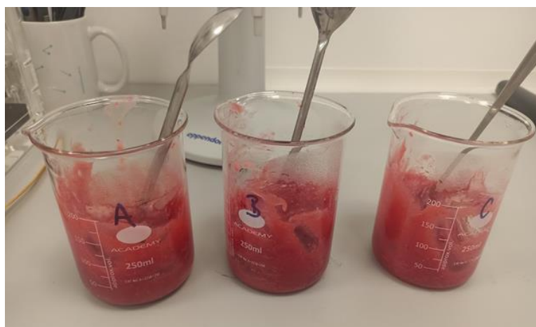
Slika 4. Zagrijane smjese za 3D ispis