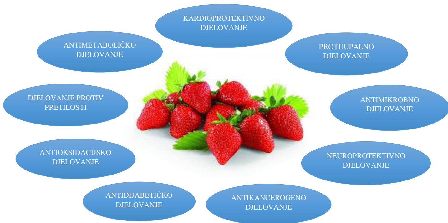
Slika 2. Zdravstveni učinci jagoda u kliničkim studijama (prema Afrin i sur., 2016)

U jagodama su prisutni i elagitanini (ET) koji predstavljaju različite kombinacije galne kiseline i heksahidroksidifenske kiseline s glukozom, sa širokim rasponom struktura kao što su monomeri (tj. glikozidi elaginske kiseline (EA)), oligomeri (tj. sanguin H-6, najtipičniji ET u jagoda) i kompleksni polimeri. Zajedno s galotanimima nazivaju se hidroliziranim taninima, a nakon hidrolize otpuštaju elaginsku kiselinu, iako se mogu proizvesti i drugi metaboliti koji su karakteristični za pojedinačne ET (tj. galaginska kiselina) (Enomoto, 2021; Giampieri i sur., 2012). ET imaju antikancerogena, antimutagena, antidijabetička, antibakterijska i antimikotična svojstva (Sharifi-Rad i sur., 2022; Enomoto, 2021). Dnevna porcija jagoda koja sadrži oko 250 g osigurava unos od 39-167 mg ET, ovisno o kultivaru (Gasperotti i sur., 2015). U studiji Koponen i sur. (2007), 33 namirnice koje se često konzumiraju u Finskoj analizirane su na sadržaj ET. Elagitaninski spojevi detektirani su samo u plodovima iz obitelji Rosaceae (nordijska kupina, malina, šipak, krkavina i jagoda), u rasponu od 21,7 do 83,2 mg/100 g (FW), dok su slobodni derivati EA određeni u rasponu od 0,7 do 4,3 mg/100 g (FW). Druge studije su izvijestile o sadržaju ET u jagodama od 25 do 59 mg/100 g u svježim uzorcima (Aaby i sur., 2007; Skupien i Oszmianski, 2004).