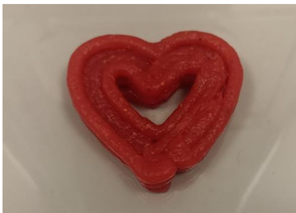
Slika 6. 3D ispisani uzorak 3D-A