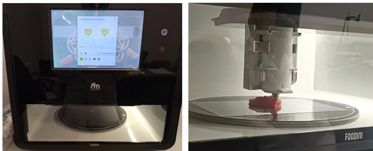
Slika 5. Foodini 3D pisač

U ovom eksperimentu su korištene kapsule volumena 100 mL s promjerom mlaznica od 4 mm. Odabir željenog oblika i ostalih parametara ispisa postavljeni su putem Foodini Creator Software-a na računalu. Za 3D ispis odabran je oblik srca ispisan u tri sloja dimenzija 53 mm × 51 mm × 12 mm (duljina × širina × visina) (slika 6).