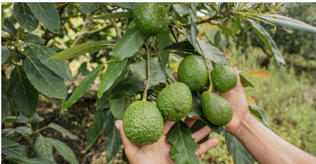
Slika 1. Stablo i plod avokada (Anonymous 1)