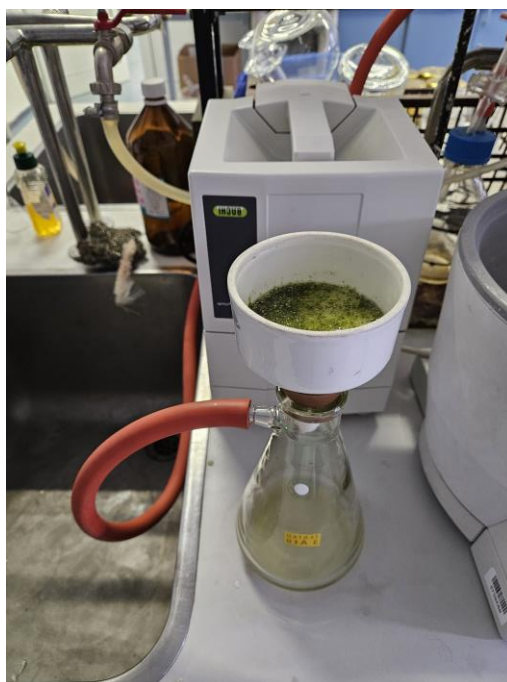
Slika 5. Filtracija uzorka avokada pomoću Büchnerov-og lijevka