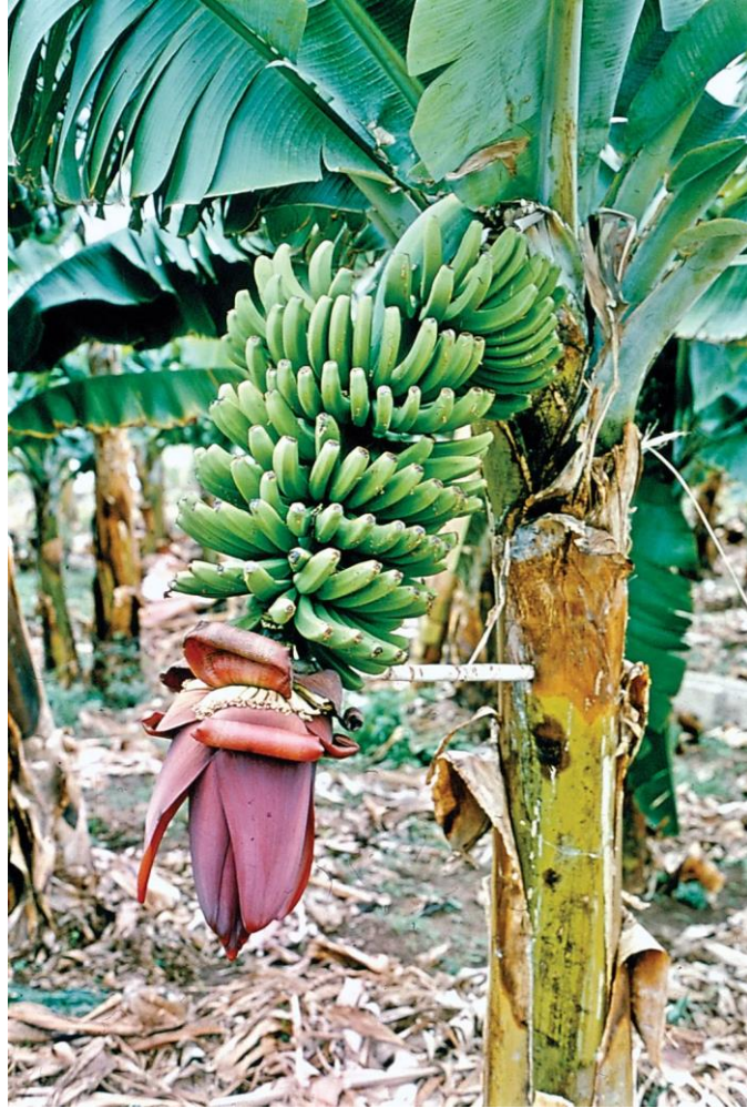
Slika 2. Stablo i plod banane (Anonymous 2)