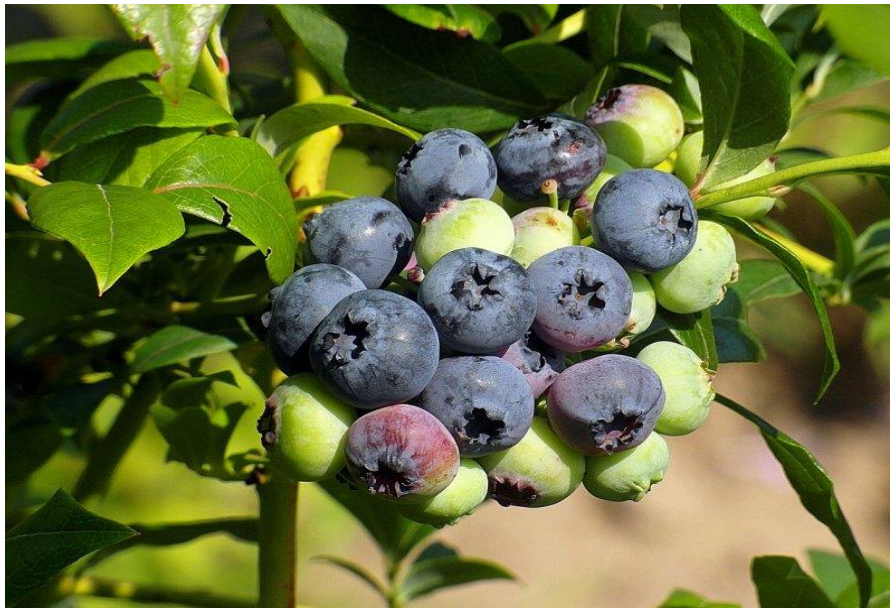
Slika 1. Obična borovnica (Vrtlarica, 2020)

Vrijeme sazrijevanja bobica traje između 8 i 16 tjedana, ali se ne odvija istovremeno. Prilikom sazrijevanja bobice borovnica prolaze tri razvojne faze u kojima dolazi do formiranja šećera, razgradnje organskih kiselina, nastanka karakterističnih aromatskih tvari te porasta na masi. Berba se provodi kada su bobice lako odvojive od grma što ukazuje na njihovu potpunu zrelost. Bobice je moguće upotrijebiti kao svježe, osušene ili prerađene u džemove, sokove i njima slične proizvode. Korijen biljke je vlaknast, vrlo tanak i razgranat te ne raste duboko u zemlju, a najviše mu pogoduju temperature od 14 °C do 18 °C dok se na temperaturama ispod 8 °C njegov rast značajno usporava (Ebert, 2008). S obzirom na to da ne posjeduje korijenove dlačice, korijen nije osobito djelotvoran pri uzimanju vode i hranjivih tvari iz zemlje pa grmovi borovnica u nepovoljnim uvjetima usporavaju rast. Listovi biljke su ovalno-eliptičnog oblika, svjetlozelene boje, a veličinom variraju do 3 cm duljine. Cvjetovi biljke su ružičaste boje i sferičnog oblika, a smješteni su u pazuhu lista (Dujmović Purgar i sur.). Cvjetanje obične borovnice traje od svibnja do lipnja, a sazrijevanje plodova od lipnja do kolovoza. Vrste roda Vaccinium su diplodi ( 2n=24 ) i tetraploidi ( 2n=48 ) (Volčević, 2005).