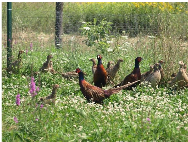
Slika 3. Fazani iz kontroliranog uzgoja (Anonymous 5, 2015)

Kontrolirani uzgoj divljači zahtjeva velike investicije jer su sami uređaji vrlo skupi (volijere, inkubatori, valionici itd.), te stručno osoblje. I dalje se ovaj način uzgoja najuspješnije primjenjuje kod fazana (Darabuš, 2004c).