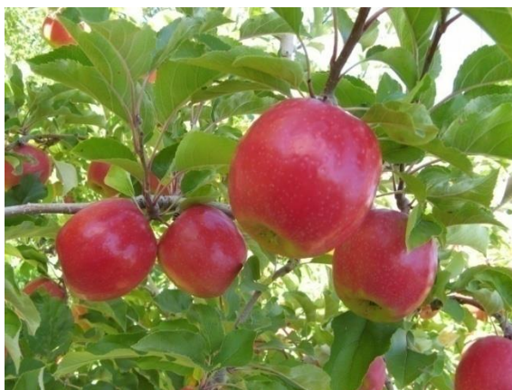
Slika 1. Plod jabuke Cripps Pink ( http://www.erinnudi.com/ )

Samo one Pink Cripps jabuke odgovarajuće vrhunske kvalitete mogu dobiti oznaku i biti prodane samo putem zaštićenog brenda koji nosi ime Pink Lady.