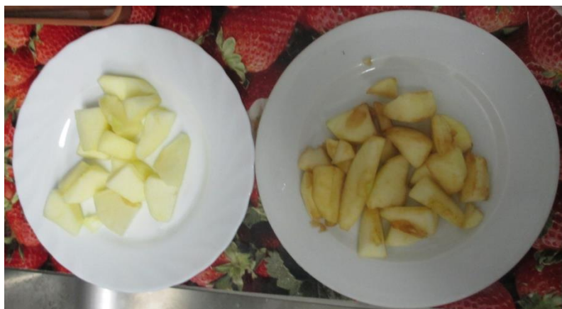
Slika 3. Usporedba boje prvog i posljednjeg dana

Opisano u prethodnom paragrafu potvrđuje i slika 3.