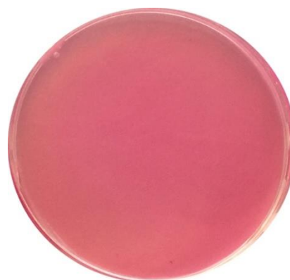
Slika 6. b) PCA podloga, 8 dan, podloga