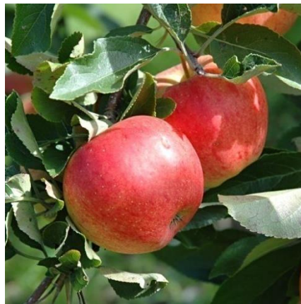
Slika 1. Jabuka (Anonymus, 2010.)

Jabuka raste na drvetu niskog do srednjeg rasta, s razgranatom krošnjom. Najpogodnija podloga za uzgoj jabuka je isušeno tlo, pH 6 – 7, ali je stablo vrlo prilagodljivo, te jabuke rastu na različitom tlu diljem svijeta.