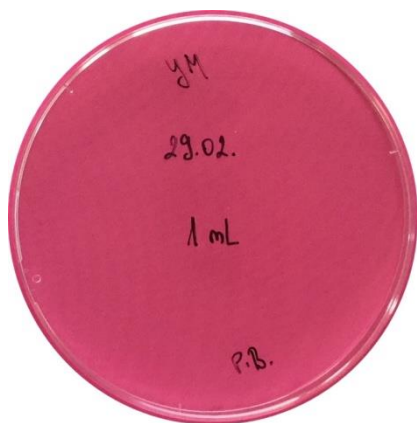
Slika 7. a) YM podloga, 8 dan, Petrijeva zdjelica