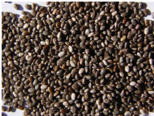
Slika 3 Chia sjemenke (Muñoz i sur., 2013)

mikotoksina, a sve navedene vrijednosti bile su u skladu s maksimalnim dopuštenim vrijednostima. Što se skladištenja tiče, priložene su informacije kako skladištenje duljine od 18 mjeseci pri temperaturama od 5 do 35 °C i relativne vlažnosti od 40 do 85%, nema negativnih utjecaja na kvalitetu i nutritivni sastav proizvoda (EFSA, 2009). Podnositelj zahtjeva preporučio je kako bi udio chia sjemenki (u cijelom obliku ili mljevene) u raznim vrstama kruha trebao iznositi 5%, što je utemeljeno na prosječnoj konzumaciji kruha u Ujedinjenom Kraljevstvu, a prema tim vrijednostima, dnevni unos chia sjemenki iz kruha kod odraslih osoba iznosio bi od 5,1 g/dan do 11,6 g/dan (Henderson i sur., 2002). Države članice i EFSA zaključile su kako te vrijednosti nisu reprezentativne za cijelu Europsku Uniju te je podnositelj zahtjeva dodatno priložio prosječnu konzumaciju kruha u 17 država članica. Prema prosječnoj konzumaciji kruha najviše je odstupala Bugarska (301 g/dan), a ostale države članice prosječno su konzumirale 181 g/dan kruha što je veća količina u odnosu na stanovnike Ujedinjenog Kraljevstva (140 g/dan).