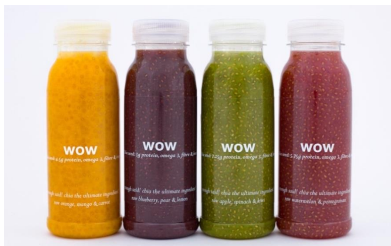
Slika 4 Sokovi od voća i povrća sa chia sjemenkama (Anonymous, 2017)

Ono što ide u prilog proizvodima koji sadrže chia sjemenke, odnosno samim chia sjemenkama, jest činjenica da ne sadrže česte alergene koji su prisutni u prehrambenim proizvodima, jaja i mlijeko, a osim toga ne sadrže gluten. Osim što su chia sjemenke izvrstan izbor u prehrani osoba koje boluju od celijakije te zbog toga ne smiju konzumirati gluten, vrlo su zanimljiva namirnica i ostalim osobama koje svojevolumino izbjegavaju konzumaciju glutena, s obzirom na to da prehrana bez glutena danas postaje sve popularnija. Osim toga, chia sjemenke predstavljaju dobar izvor proteina i vlakana, te imaju dobar vitaminsko-mineralni sastav, što ih čini poželjnom namirnicom u prehrani vegana i vegetarijanaca. Sve navedeno osigurava chia sjemenkama velik potencijal u prehrambenoj industriji.