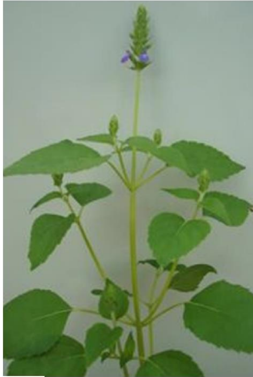
Slika 1. Salvia hispanica L. sa ljubičastim cvjetovima (Sapio i sur., 2012)

Sjemenke su vrlo sitne ( 1.87 \pm 0.1 mm dužine, 1,21 \pm 0,08 mm širine), ovalnog oblika i glatke površine (Muñoz i sur., 2012). Najčešća boja sjemenki je siva sa crnim točkicama, međutim moguće su i kombinacije crne, sive, smeđe i bijele boje. Sastoje se od tri sloja: vanjski omotač, endosperm i klica. Ono što je karakteristično za chia sjemenke jest prisutnost polisaharida u vanjskom omotaču koji u kontaktu s vodom stvaraju želatinoznu ovojnicu (engl. mucilage ) oko sjemenke. Smatra se kako je to svojstvo zapravo prilagodba biljke na sušne uvjete u kojima raste, čime se regulira gubitak vode iz sjemenki (Valdivia-López i Tecante, 2015). Za komercijalnu proizvodnju chia sjemenki koju je odobrila Europska agencija za sigurnost hrane (EFSA), biljka chie sije se mehanički u količini 3-5 kg/ha, a tlu na kojem se sije može se dodati herbicid trifluralin u količini od 2 L/ha (EFSA, 2009). Insekticidi se ne koriste, a prilikom sjetve dodaje se gnojivo od diamonijeva fosfata (DAP). Nakon 30-45 dana dodaje se gnojivo urea u količini od 150 kg/he, također mehanički. Žetva se vrši mehanički, a sjemenke se čiste od mogućih kontaminanata, nakon čega se pakiraju u vreće za izvoz (najčešće polipropilenske) u količini od 20-25 kg po vreći (CBI, 2017). Sjemenke imaju nisku higroskopnost zbog čega su vrlo stabilne prilikom skladištenja, a antioksidansi koje sadrže sprječavaju proces oksidacije ulja prisutnih u sjemenkama.